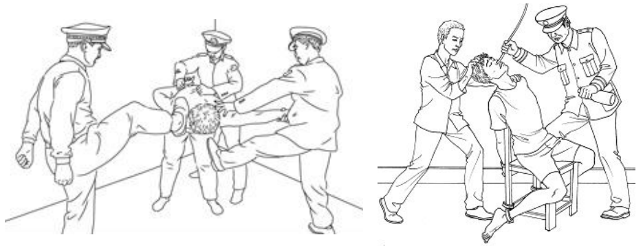
中共酷刑示意图：毒打、摧残性灌食