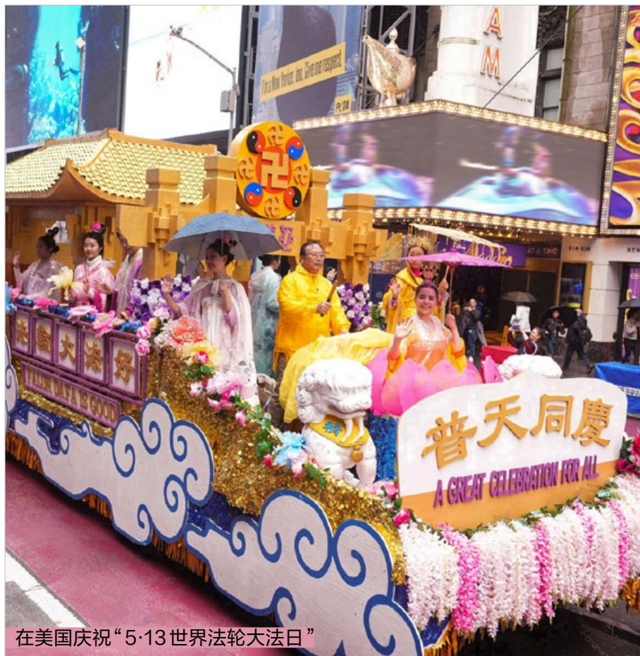
在美国庆祝“5·13世界法轮大法日”