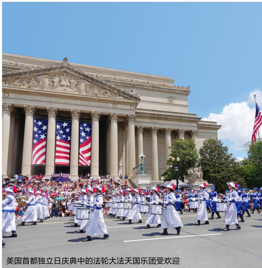
美国首都独立日庆典中的法轮大法天国乐团受欢迎