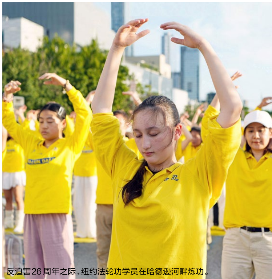
反迫害26周年之际，纽约法轮功学员在哈德逊河畔炼功。