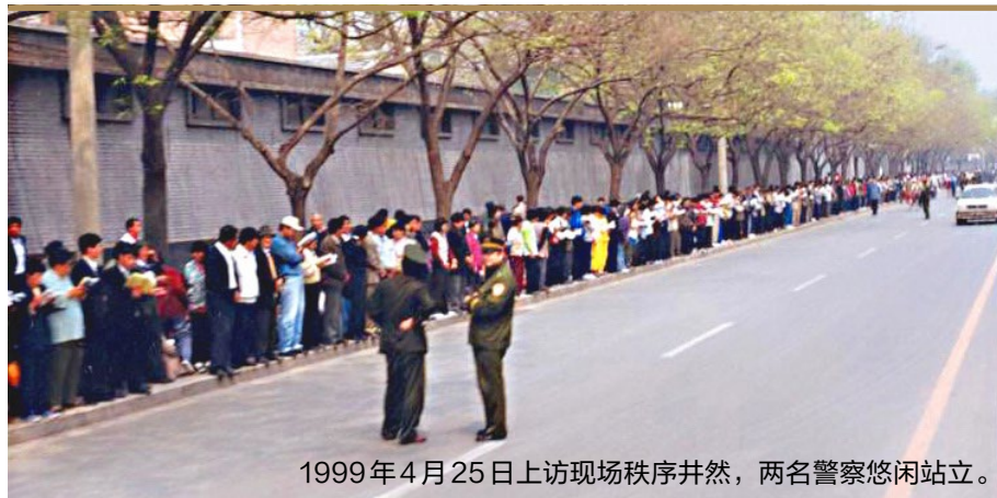
1999年4月25日上访现场秩序井然，两名警察悠闲站立。