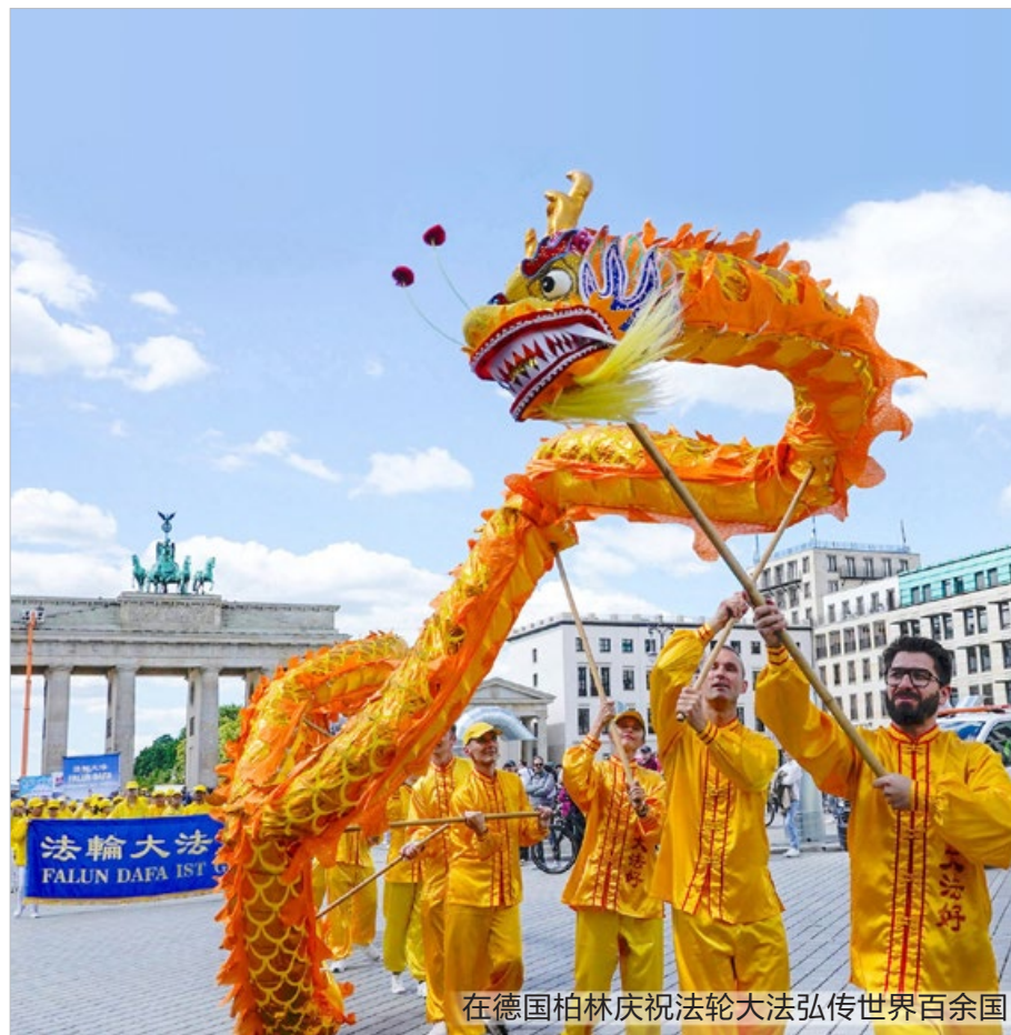
在德国柏林庆祝法轮大法弘传世界百余国