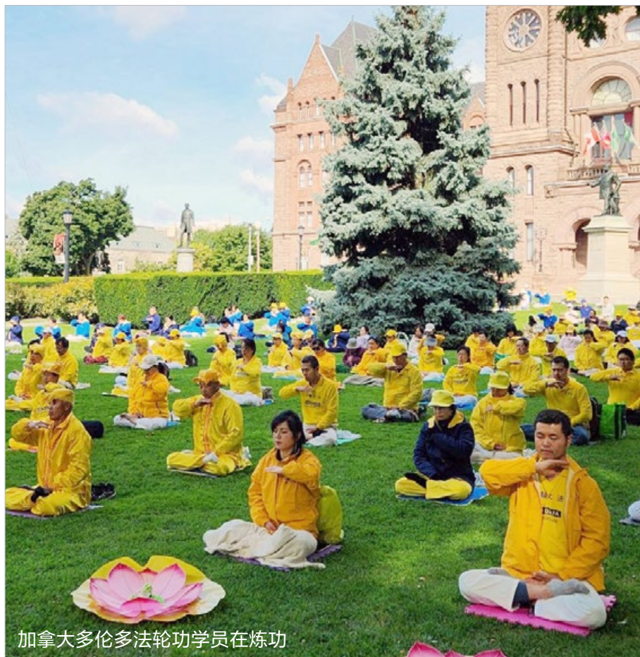
加拿大多伦多法轮功学员在炼功