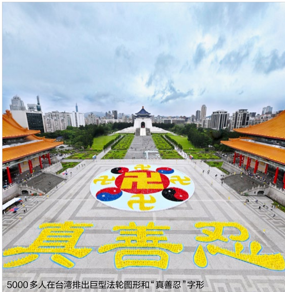
5000 多人在台湾排出巨型法轮图形和“真善忍”字形