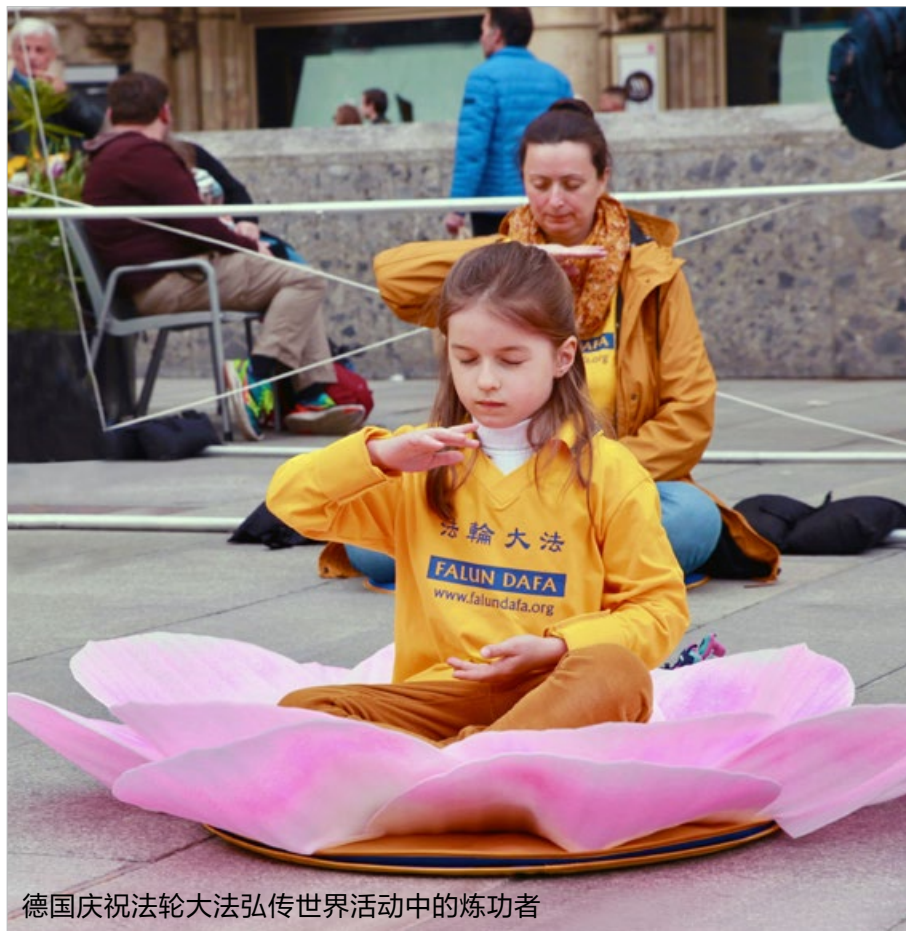
德国庆祝法轮大法弘传世界活动中的炼功者