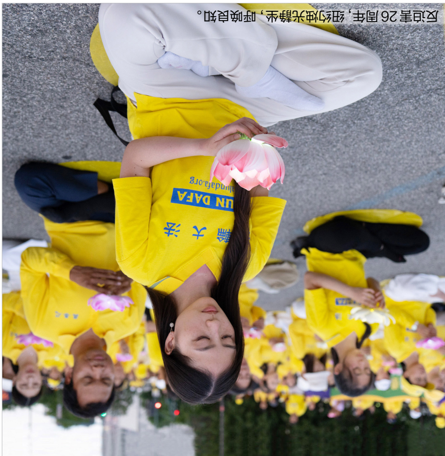
反迫害26周年, 纽约烛光静坐, 呼唤良知。