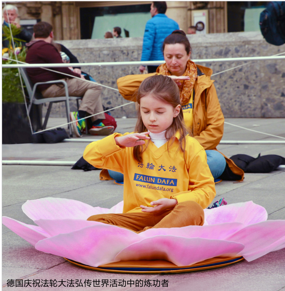
德国庆祝法轮大法弘传世界活动中的炼功者