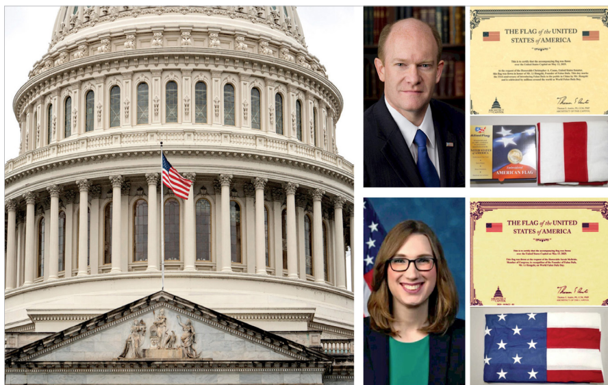
◎美国国会大厦升旗向李洪志先生致敬，联邦参议员克里斯·库恩斯（上图）与众议员莎拉·麦克布莱德（下图）赠送国旗和证书。

2025年5月13日是第26届“世界法轮大法日”暨法轮大法传世33周年，美国国会大厦当日再度升起美国国旗，表彰李洪志先生把“真、善、忍”信仰弘传世界的杰出贡献。