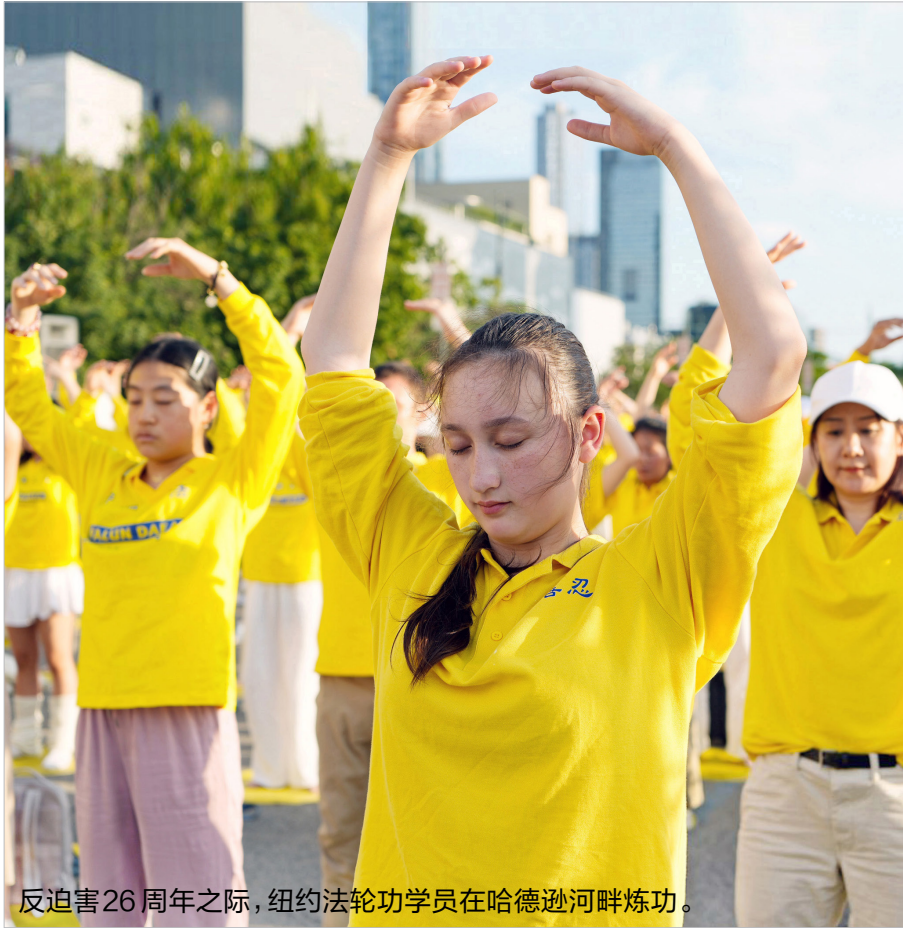
反迫害26周年之际，纽约法轮功学员在哈德逊河畔炼功。