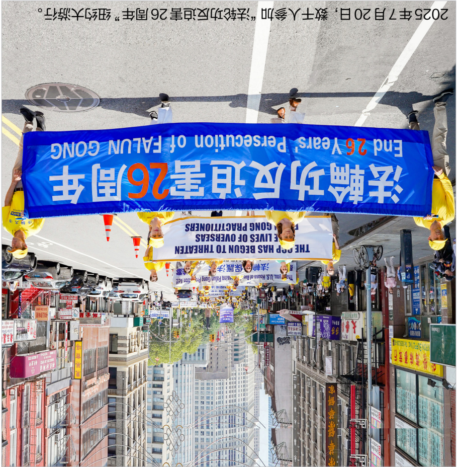
2025年7月20日，數千人參加“法輪功反迫害26周年”紐約大遊行。