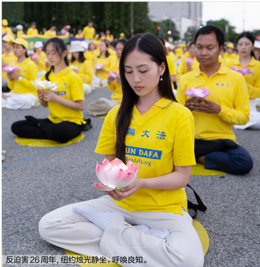
反迫害26周年, 纽约烛光静坐, 呼唤良知。