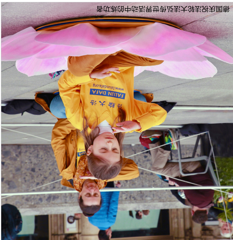
德国庆祝法轮大法弘传世界活动中的炼功者