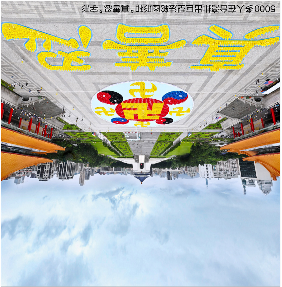
5000多人在台湾排出巨型法轮图形和“真善忍”字形