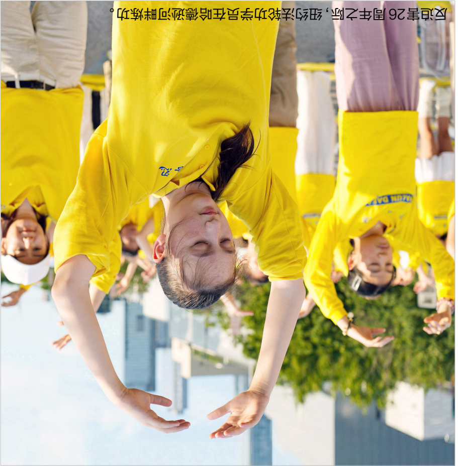
反迫害26周年之际，纽约法轮功学员在哈德逊河畔炼功。