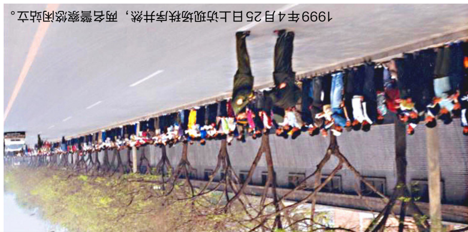
1999年4月25日上访现场秩序井然，两名警察悠闲站立。