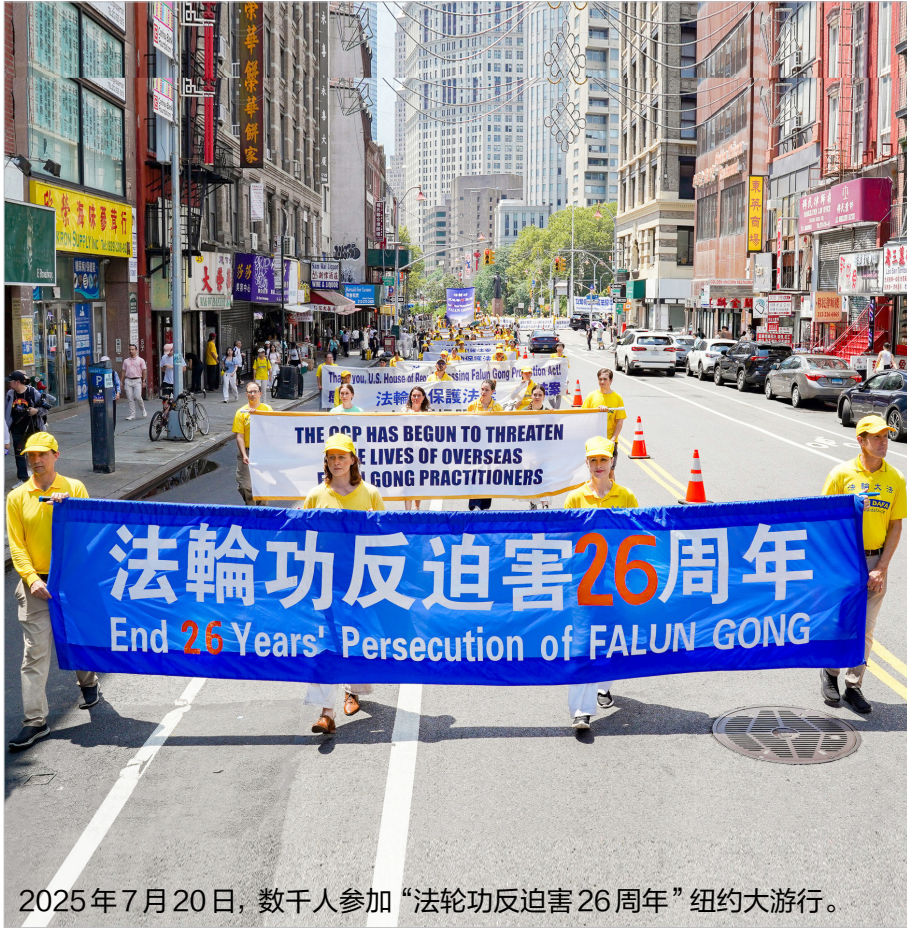
2025年7月20日，數千人參加“法輪功反迫害26周年”紐約大遊行。