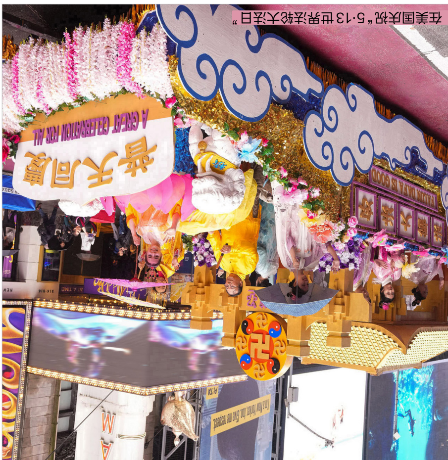
在美国庆祝“5.13世界法轮大法日”