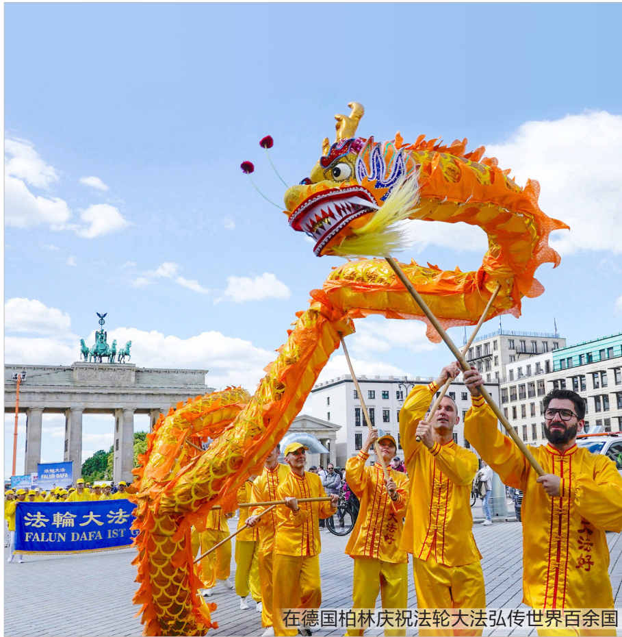
在德国柏林庆祝法轮大法弘传世界百余国