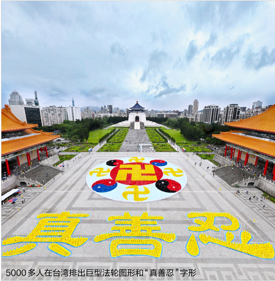
5000多人在台湾排出巨型法轮图形和“真善忍”字形