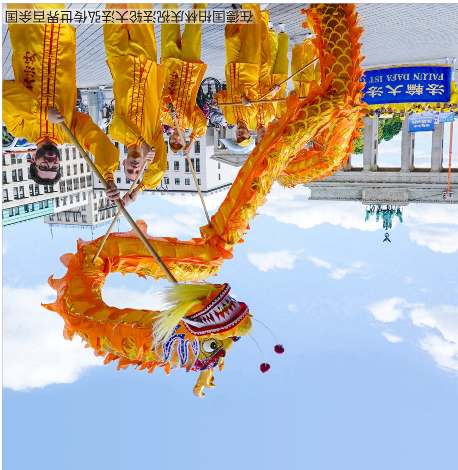
在德国柏林庆祝法轮大法弘传世界百余国