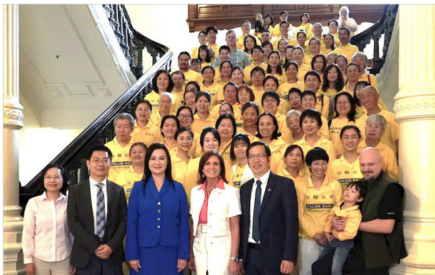
◎美国德州参众两院于2025年5月分别通过决议案，表彰法轮大法。参议院决议案发起人帕克斯顿(前排左四)与法轮功学员合影。

数据统计：在受中共迫害的26年间(1999~2025)，法轮功收到国际褒奖、支持信函和支持议案约13000件。其中7400件来自美国联邦及各级政府，约占总数的57%。