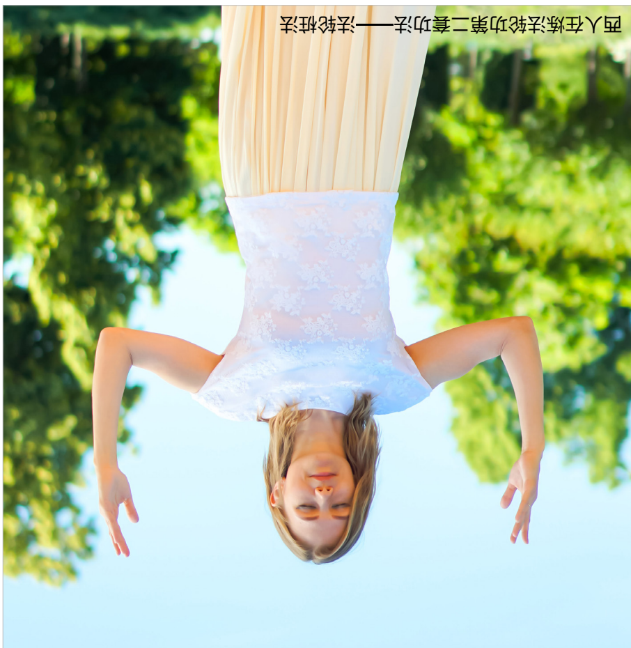
西人在炼法轮功第二套功法——法轮桩法