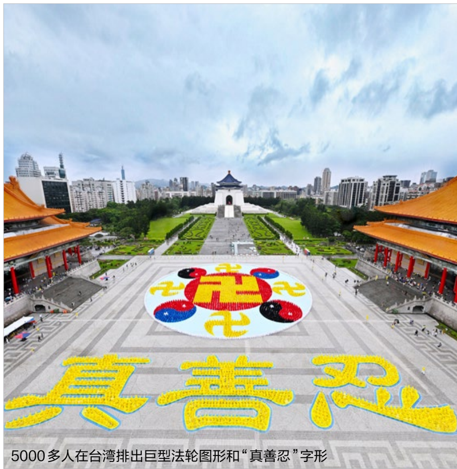
5000多人在台湾排出巨型法轮图形和“真善忍”字形