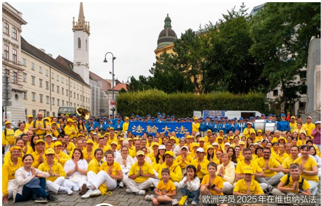
欧洲学员 2025 年在维也纳弘法