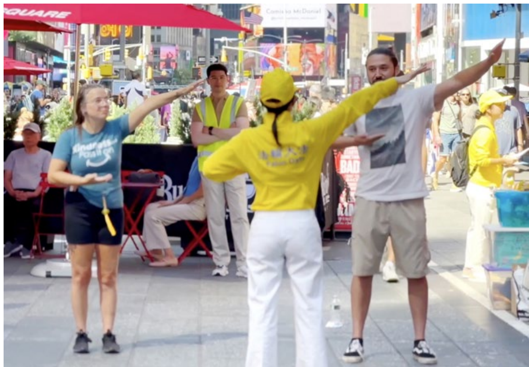
2025年8月23日，纽约时代广场，民众学炼法轮功。

答：找自己的不足并加以改进，以耐心、善意、和平方式讲解，用自己身心实践的效果证实，用他人的事例说明修炼益处。尊重不同观点，不强迫改变。多数亲友在理解后表示尊重和支持。▲