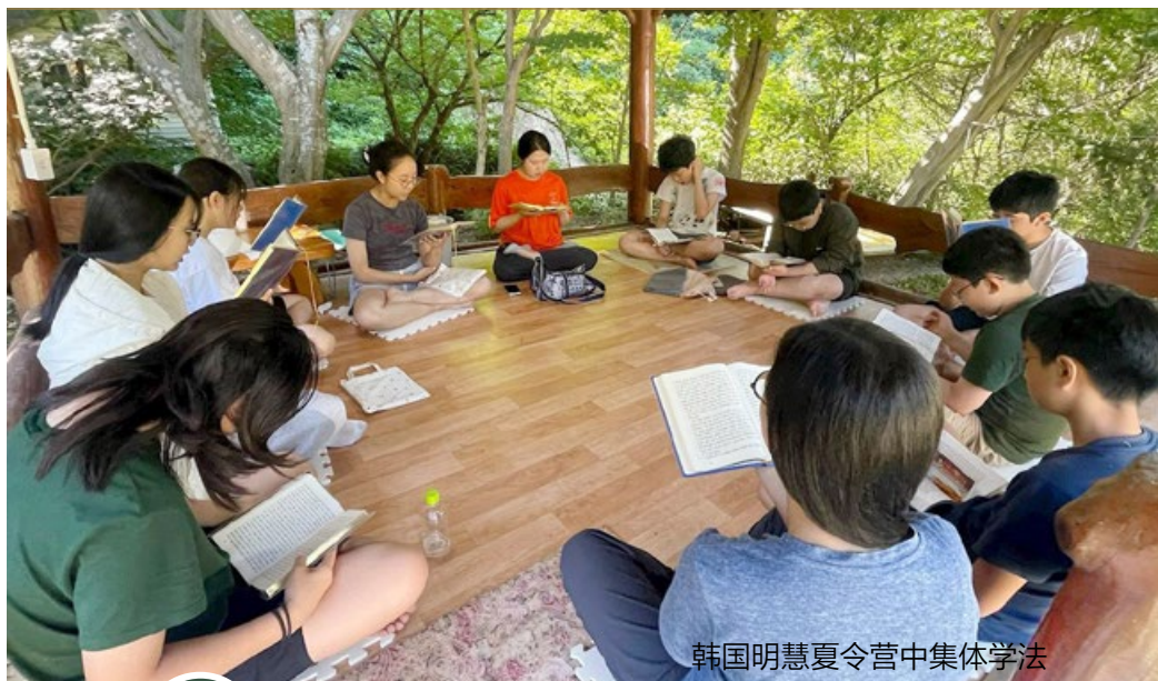
韩国明慧夏令营中集体学法