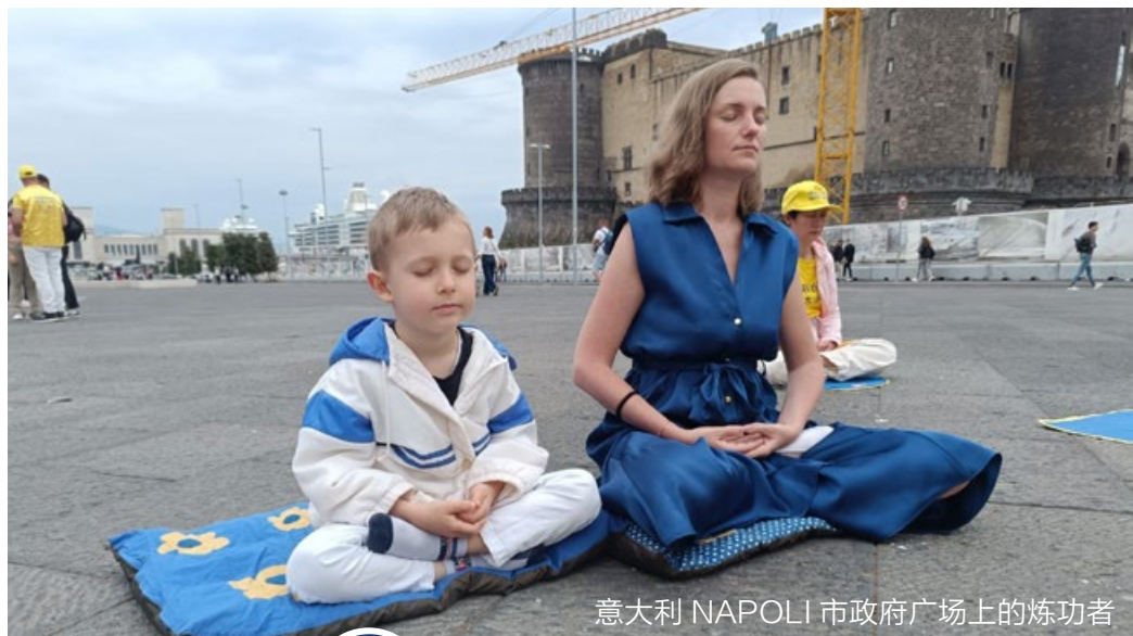
意大利 NAPOLI 市政府广场上的炼功者

答：明慧专注于法轮功真相报导与修炼文化，非商业媒体。不受商业广告或政治干扰。信息主要由学员义务整理与编发。核心目标是揭露中共迫害、维护修炼环境和方向，教育大众，而非娱乐。▲