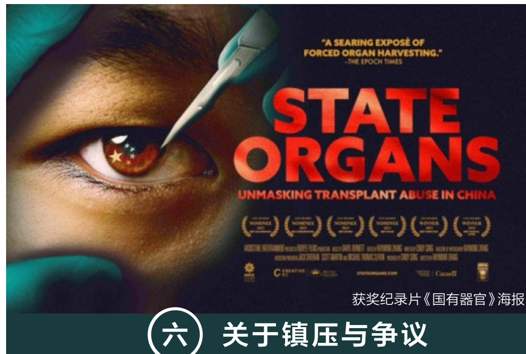
获奖纪录片《国有器官》海报