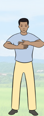
【第四套功法】 法轮周天法