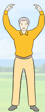
【第二套功法】 法轮桩法