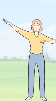
【第一套功法】 佛展千手法

法轮大法又称法轮功，是由李洪志先生于1992年5月传出的佛家上乘修炼大法，以“真善忍”为根本指导，包含五套动作舒缓、优美的功法。迄今，法轮大法已弘传世界100多个国家和地区，大法书籍被翻译成50种语言在世界各地发行。李洪志先生和法轮大法因对人类身心健康的杰出贡献，获各国政府褒奖、支持议案和信函逾万项。