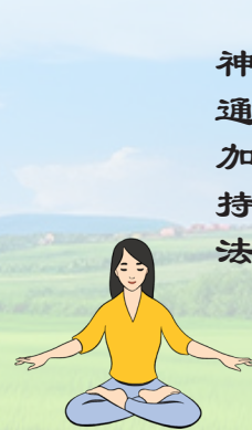
【第五套功法】 神通加持法