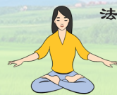
【第五套功法】 神通加持法