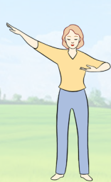
【第一套功法】 佛展千手法

法轮大法又称法轮功，是由李洪志先生于1992年5月传出的佛家上乘修炼大法，以“真善忍”为根本指导，包含五套动作舒缓、优美的功法。迄今，法轮大法已弘传世界100多个国家和地区，大法书籍被翻译成50种语言在世界各地发行。李洪志先生和法轮大法因对人类身心健康的杰出贡献，获各国政府褒奖、支持议案和信函逾万项。