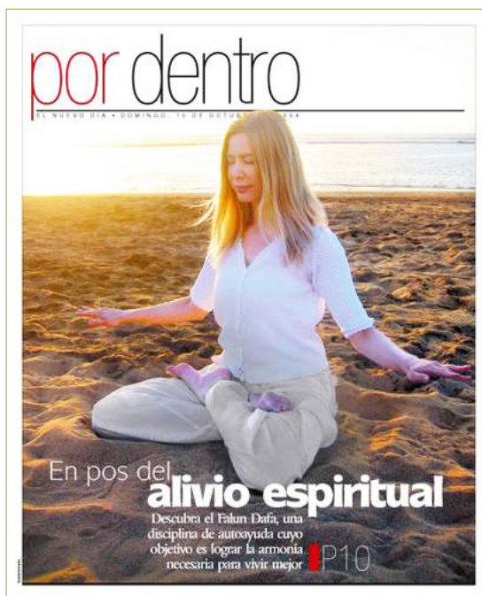
◎波多黎各最大的报纸《新的日子》刊登了记者采访珊达斯的修炼故事。

抑郁烦躁。就在此时，她惊喜地遇到了法轮大法。这是一个中国古老的修炼方法，经由修心和五套动作优美舒缓的功法，从而达到净化身体与心灵。这项修炼是基于“真善忍”的原则，使人受益无穷：如果真心修炼，可以去掉各种不良嗜好，如烟瘾及酗酒等；舒缓精神紧张，增加人体能量与活力，减缓老化，而且可以治疗疾病。这也是很多中西方医生及心理学家选择炼法轮功的原因。