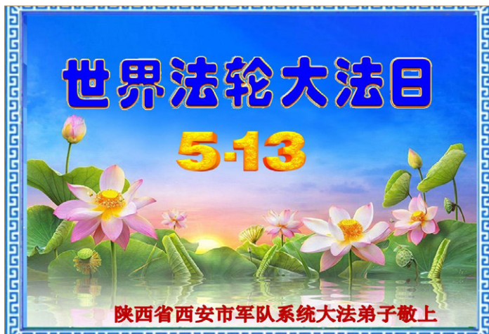
◎每逢佳节，公检法司、军队系统的大法弟子突破网络封锁向李洪志师父问好。

“翻墙”看真相，这是中共最害怕的，中国的军人们也在觉醒。据统计，中国大陆目前已有近1亿人在“翻墙”。朋友啊，空气是自由的，水是自由的，网络也应该是自由的！