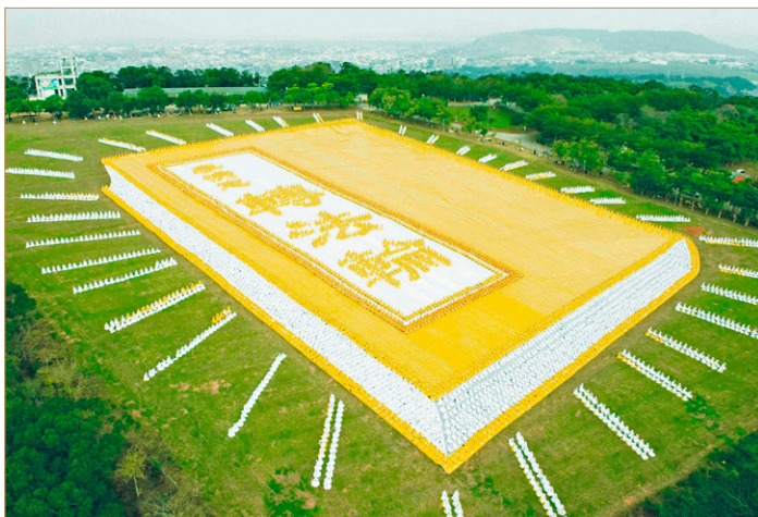
◎台湾6000多名法轮功学员，排出指导修炼的《转法轮》立体书模型。

但读了法轮大法的书籍后，我非常敬佩，里面有许多在科学方面没有的东西。《转法轮》蕴含无尽宝藏，我为能读此书感到幸运！”