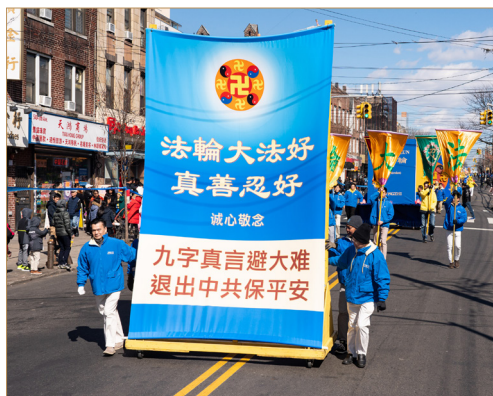
◎诚念“法轮大法好，真善忍好”能接通宇宙中正的能量，得到神的护佑。

炎。晚上父亲憋得上不来气。我郑重地请父亲跟我一起诚心念“法轮大法好，真善忍好”。父亲因为太痛苦了，就跟我不停地念了起来……第二天清晨，父亲高兴地说：“太神了！我好了！原来真有神哪！”父亲痊愈了。