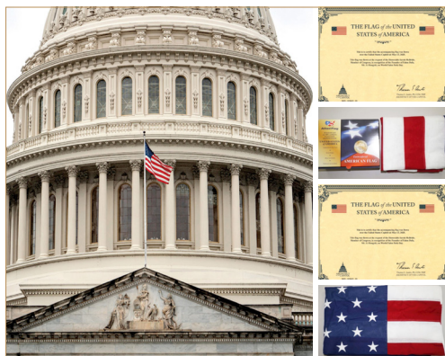
◎美国国会大厦连续两年升旗向法轮功创始人致敬，并赠送国旗和证书。