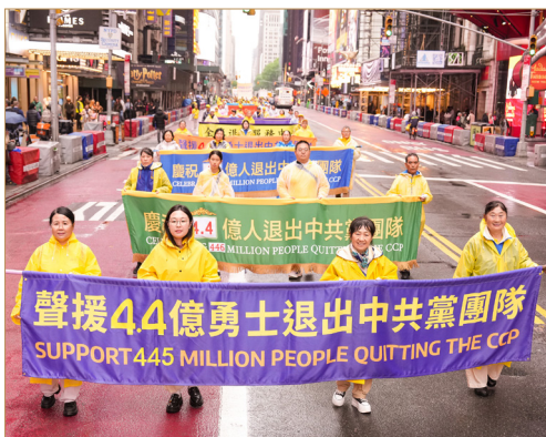
◎2025年5月9日，法轮功学员在美国举行游行，声援4.4亿勇士退出中共党团队。