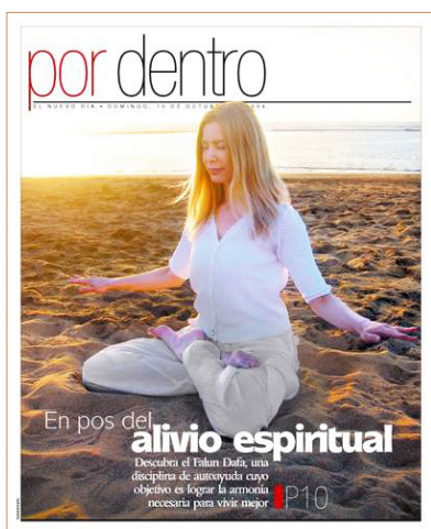
◎波多黎各最大的报纸《新的日子》刊登了记者采访珊达斯的修炼故事。

轮大法！这是一个中国古老的修炼方法，经由打坐和特别的功法净化身体与心灵。这项修炼是基于“真善忍”的原则，使人受益无穷：可以舒缓紧张、增加人体能量与活力、减缓老化；并且可以治疗人的疾病。这也是在世界各国，很多中西方医生及心理学家选择炼法轮功的原因。