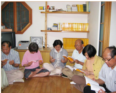
◎ 彭家的学法组设在老四家。他们在一起学《转法轮》，交流修炼心得。

彭先生说：“修炼法轮功后，大家抢着安排时间照顾母亲。兄弟姐妹们都用‘真善忍’的标准自我要求；妯娌之间关系融洽，和乐。这种幸福真是语言难以形容啊！”