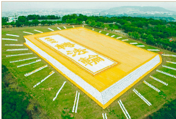
◎台湾6000多名法轮功学员，排出指导修炼的《转法轮》立体书模型。

但读了法轮大法的书籍后，我非常敬佩，里面有许多在科学方面没有的东西。《转法轮》蕴含无尽宝藏，我为能读此书感到幸运！”