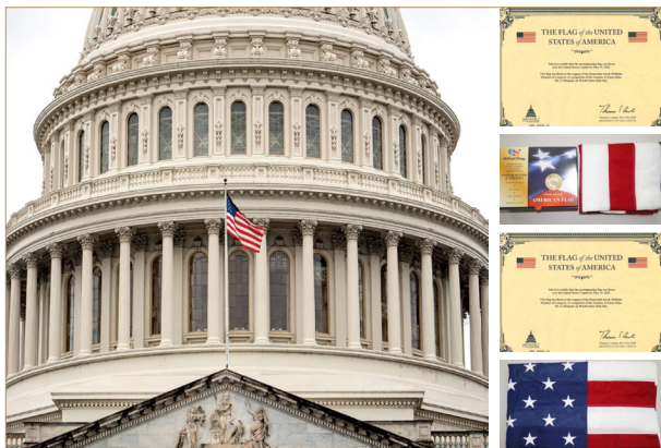
◎美国国会大厦连续两年升旗向法轮大法创始人致敬，并赠送国旗和证书。

同一天，加拿大19个城市举行升旗仪式，对李洪志大师表达敬意。首都渥太华市长及议员在贺信中说：“‘真善忍’的准则是受欢迎的教诲。感谢你们促进个人的身心健康，并为一个更和平、更和谐的世界而努力。”