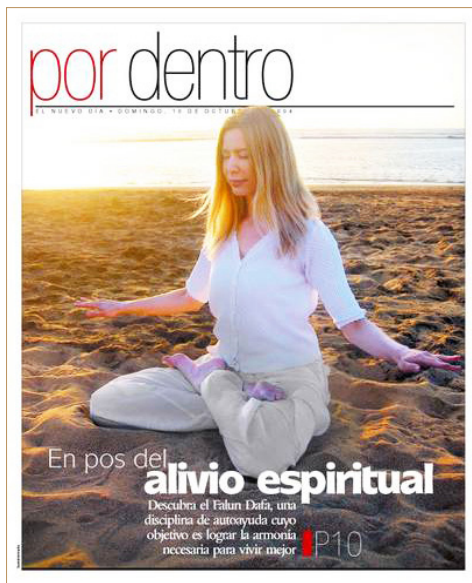
◎波多黎各最大的报纸《新的日子》刊登了记者采访珊达斯的修炼故事。

抑郁烦躁。就在此时，她惊喜地遇到了法轮大法。这是一个中国古老的修炼方法，经由修心和五套动作优美舒缓的功法，从而达到净化身体与心灵。这项修炼是基于“真善忍”的原则，使人受益无穷：如果真心修炼，可以去掉各种不良瘾好，如烟瘾及酗酒等；舒缓精神紧张，增加人体能量与活力，减缓老化，而且可以治疗疾病。这也是很多中西方医生及心理学家选择炼法轮功的原因。