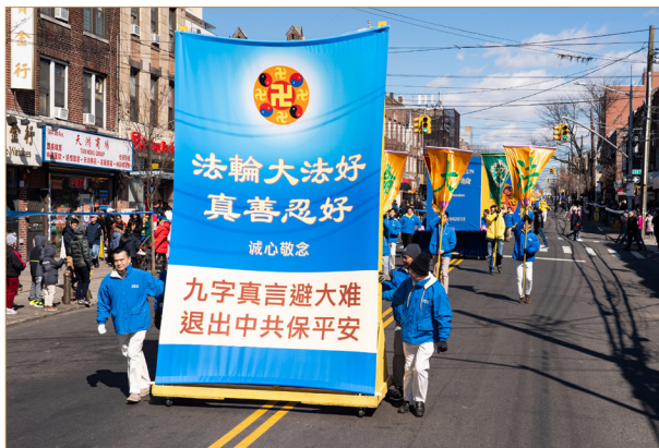
◎诚心“法轮大法好，真善忍好”能接通宇宙中正的能量，得到神的护佑。

晚上，父亲突然头疼，憋得上不来气。我郑重地请父亲跟我一起诚心念“法轮大法好，真善忍好”。以前父亲不相信，但因为太痛苦了，无奈之下就不停地念了起来……第二天清晨，我刚刚醒来，就听父亲很高兴地跟我说：“太神了！我好了！原来真有神哪！”父亲痊愈了，他胃口大开！