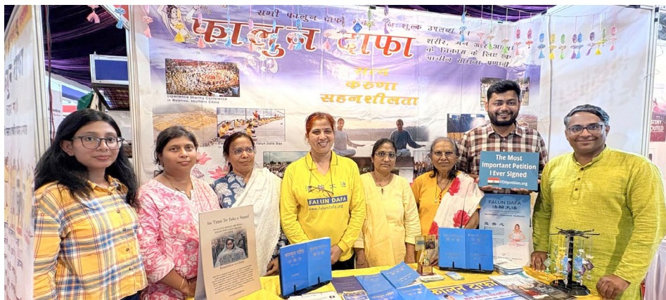
在印度浦那书展上，法轮功学员在法轮大法的展位前合影