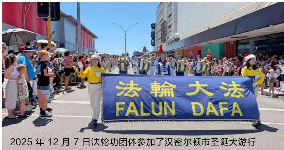
2025 年 12 月 7 日法轮功团体参加了汉密尔顿市圣诞大游行

纷向队伍挥手致意。不少民众表示，他们不仅喜爱中国传统文化，也非常认同法轮功学员秉持的“真、善、忍”这一普世价值。