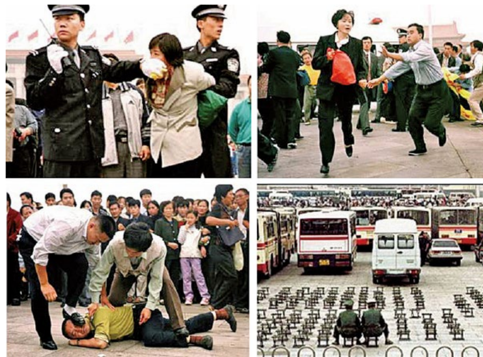
▲ 法轮功在大陆持续受中共打压，图为2000年法轮功学员在天安门广场和平请愿，遭到公安及便衣的殴打

一直是迫害法轮功较为严重的地区之一。据明慧网不完全统计，至少已有680名法轮功学员在当地被迫害致死，占全国已知案例的约13%。由于中共长期严密封锁相关信息，实际死亡人数被认为远高于公开数据，目前能够核实的，仅是透过民间渠道传出的“冰山一角”。