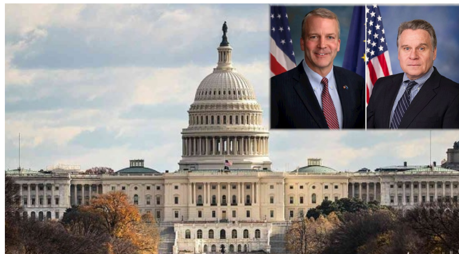
2025年12月10日美国国会及行政当局中国委员会主席丹·沙利文（左）参议员和共同主席克里斯·史密斯（右）发表声明，谴责中共侵犯人权