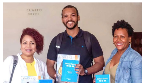
观众与法轮大法书籍合影

影片通过一个美丽的故事，以温和而生动的方式传递真、善、忍的核心价值。活动最后，学员向孩子们赠送了手工制作的纸莲花作为纪念品。■