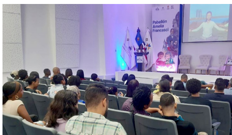
观众参加法轮大法介绍讲座