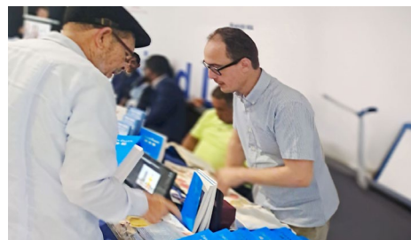
法轮功学员向参观者介绍