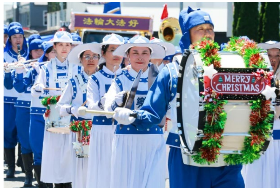
新西兰汉密尔顿媒体《怀卡托时报》(Waikato Times)报道了此次游行，并选用了法轮功团体的图片