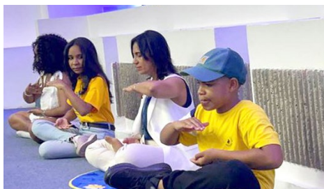
观众参与现场功法演示