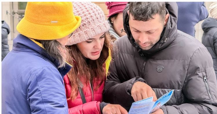
法轮功学员在钱币广场举办讲真相和反迫害征签活动