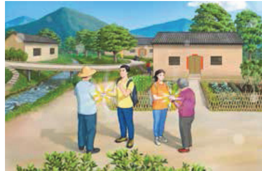
▲ 그림은 파룬궁 수련자들이 사람들에게 직접 진상을 알리고 리홍쯔 사부님의 경문 ‘왜 인류가 존재하게 되었는가’를 건네는 모습을 묘사했는데 더 많은 사람이 무사히 미래로 나아갈 수 있도록 하기 위함이다. 저자: 금강(金剛).

내가 진상을 알리고 ‘삼퇴’를 원하는 과정에서, 당 문화의 영향을 받은 일부 사람들은 ‘탈당·탈단·탈대’라는 말을 듣는 순간 정치를 한다고 오해한다. 그럴 때마다 이 동창의 사례를 들어 설명했다. 생명으로 맹세하는 일은 결코 가볍게 넘길 문제가 아니며, 반드시 그 맹세를 제거해야 한다. 사람들은 이 이야기를 들은 뒤에야 왜 ‘삼퇴’가 필요한지 비교적 쉽게 이해한다.