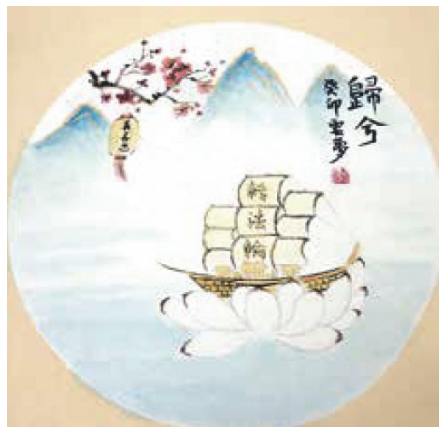
▲ 회화: 《돌아가다(归兮)》, 저자: 허난 대법제자

이제 연공에 대해 말해 보겠다. 사부님께서는 중생을 널리 제도하시며 성명쌍수(性命雙修)의 공법을 전하셨다. 제