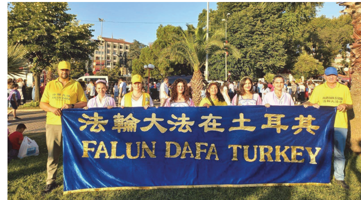
◀ 2025년 4월 초, 터키의 파룬궁 수련자들이 현지 오렌지꽃 축제에 참가해 관광객들에게 파룬궁 진상 자료를 배포했다.

사업을 하며 자주 해외를 다닌다. 많은 나라의 사람들이 내가 약도 쓰지 않고 의사의 치료도 받지 않고 마약과 알코올 중독을 끊었다고 하자, 어떻게 가능했는지 묻곤 했다. 나는 그들에게 파룬따파를 수련했기 때문이라고 말했고, ‘전법륜’과 파룬따파 관련 웹사이트를 읽어보라고 권했다. 사람들은 내가 술에