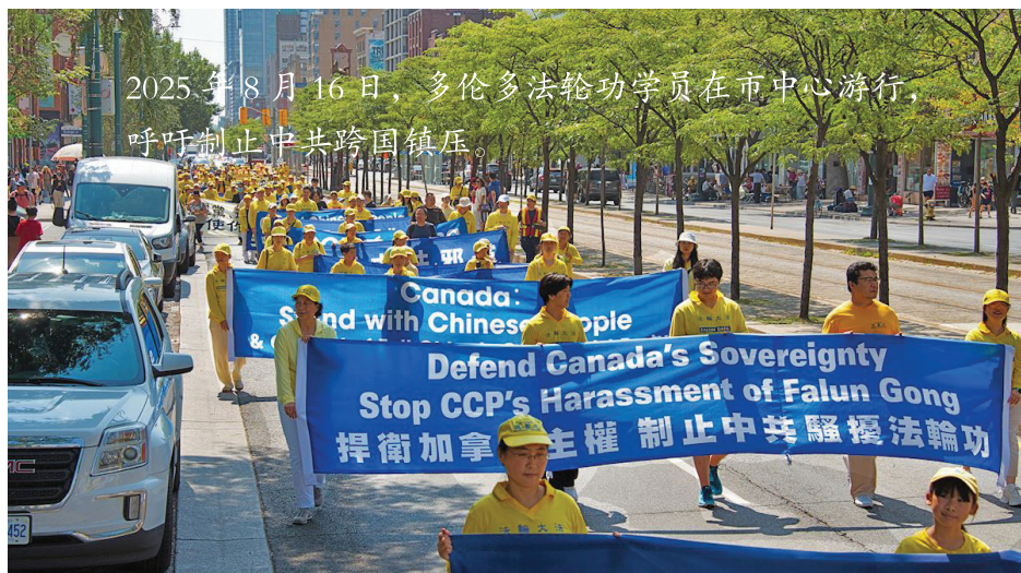
2025年8月16日，多伦多法轮功学员在市中心游行，呼吁制止中共跨国镇压。

在近年来，中共跨国镇压更进一步升级，目标包括法轮功学员及由法轮功学员创立、享誉全球的神韵艺术团。在加拿大及其它民主国家，神韵与法轮功社群遭遇骚扰、假讯息、监控，甚至炸弹与枪击威胁。