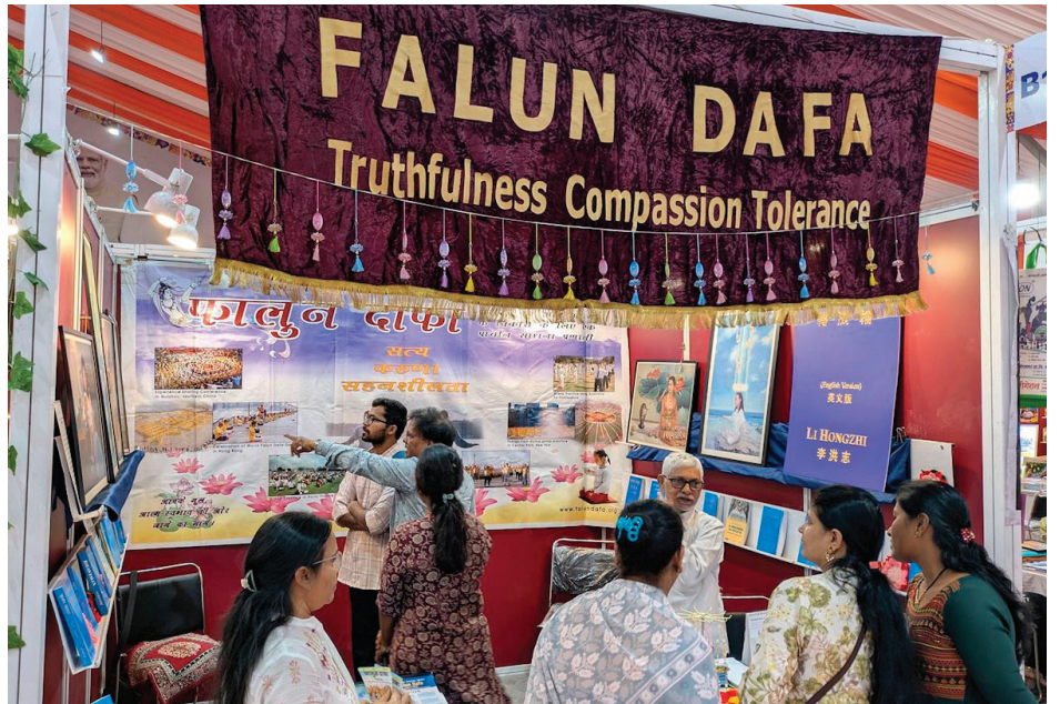
▲ 2025年印度浦那书展上的参观者在法轮大法展位上了解真相。

在法轮大法展位上，学员们展示了大法著作《转法轮》和《法轮功》，并展出了“真善忍国际美展”的部分艺术作品。来自大学、医疗界、艺术界、政界等各领域的参观者，以及众多爱书人士纷纷驻足了解。当得知法轮大法在全球各地均由志愿者无偿教功时，许多人深受触动。大量访客对印度的网上义务教功课程表现出浓厚兴趣，并选购了英文、印地文和马