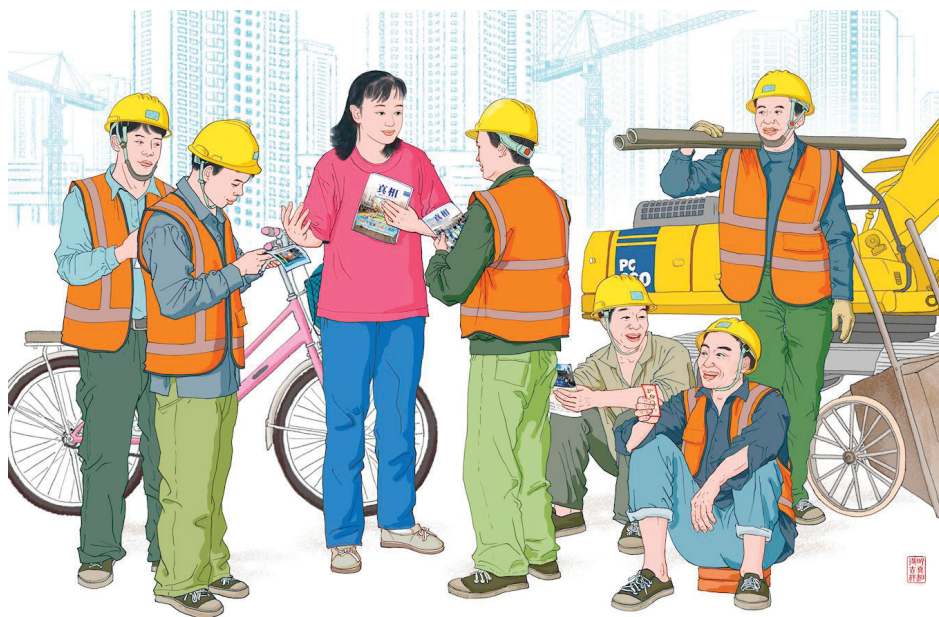
大陆大法弟子在建筑工地传播明慧网《真相》月刊，救度世人。（明慧网）