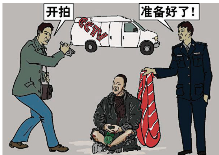
中共导演“天安门自焚”欺骗全国民众。

尽管官方无法解释为何众多警察背着灭火器巡逻，为何主要当事人的混身乌黑、发际线和塑料雪碧瓶却完好无损等诸多破绽，中国国内的媒体仍在二十四小时时间内发稿定性，向世界播放，并将其作为迫害合法化的核心叙事，强制全国上下学习、表态，甚至写入中小学课本。