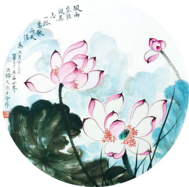
水墨画：风雨岂能毁其志。（明慧网）

我的心态摆正了，符合了法轮大法修炼人的标准，我的智慧就被打开了，脑袋特别好使，教学质量大为提高，连年获得教学优秀奖，深受学生的欢迎。本学院其它年级的、外学院的、别的大学的学生都有来旁听我讲课的。学院为减少转专业或退学的新生，把我应该在大二开的课挪到大一第一学期，这样，真有想转专业、想退学重考的新生听了我的课，觉得有这么好的老师，这个专业、这个大学值得念了。