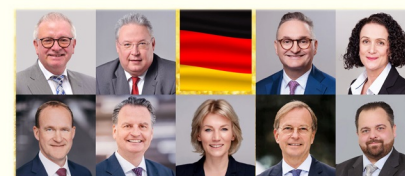
图：德国各级政要声援法轮功学员反迫害 26 年

法轮功学员反迫害 26 年，德国多城市举办了各种活动，揭露中共对海内外上亿法轮功学员的迫害真相。多名德国政要表达了他们对法轮功学员坚持和平反迫害的敬意与支持。