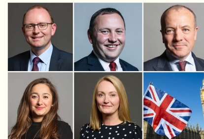
图：国会议员安德鲁·库珀，伊恩·默里，迈克·凯恩，费里亚尔·克拉克，乔·普拉特

2025 年 9 月，针对中共持续 26 年的对法轮功的迫害及活摘器官罪行，英国多位政府官员与国会议员相继发声 谴责中共对信仰自由的践踏并呼吁国际社会采取行动，制止这场暴行。