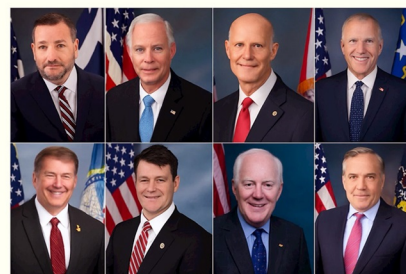
图：参议院《法轮功保护法案》(S.817) 提案人

2025 年 11 月 7 日，美国宾夕法尼亚州共和党联邦参议员大卫·麦考尔米克 (David McCormick) 加入参议院《法轮功保护法案》共同提案人的行列。目前已有八位美国联邦参议员联名推动该法案。