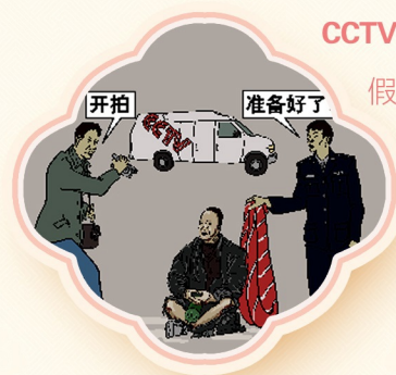
CCTV 拍摄 假自焚