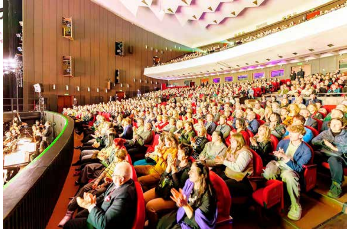
■ 神韵艺术团在波兰罗兹大剧院五场演出门票全部提前售罄。图为一月十一日下午第四场演出的盛况。

人心生一念，天地尽皆知。在法轮大法遭到迫害时，您能明白是非、支持大法，这是最珍贵的善念，您就会得到上天的佑护。这不是迷信，而是“善恶有报”天理的体现。因为诚心敬念“法轮大法好、真善忍好”，危难时刻化险为夷、遇难呈祥的例子比比皆是。