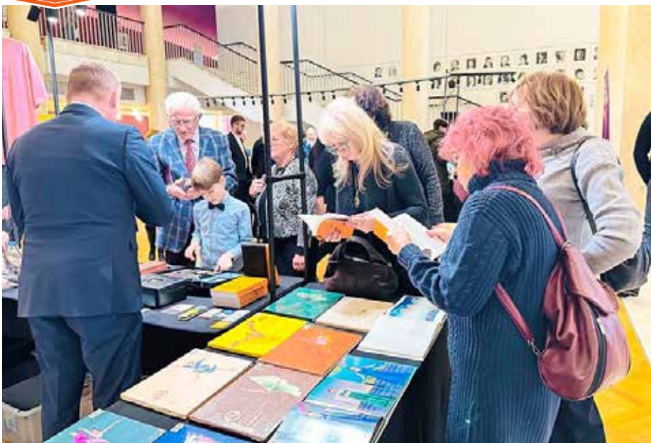
■ 神韵在波兰罗兹大剧院上演期间，法轮大法书籍热销。