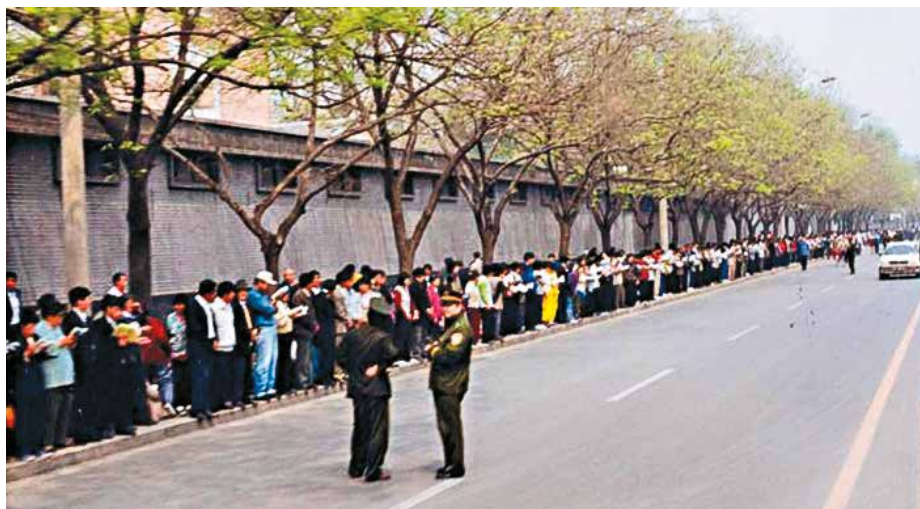
■ 逾万名法轮功学员到北京和平上访历史图片。

作为迫害元凶，江泽民死后已经坠入无间地狱，遭受永无休止的地狱刑罚，以偿还其迫害佛法犯下的滔天罪恶。🌀