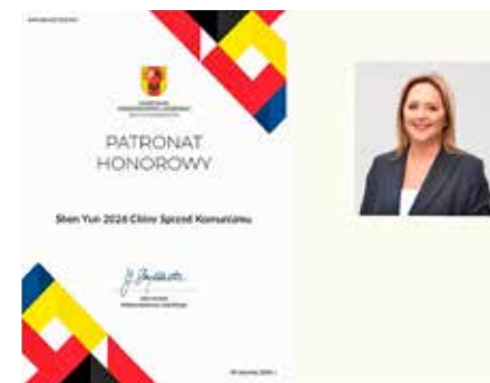
■ 罗兹省长斯克兹德鲁斯卡女士褒奖神韵艺术团。

就展现了中国文化。所以我一定会认真阅读这本书，以了解更多信息，并深入了解这些故事的背景。”