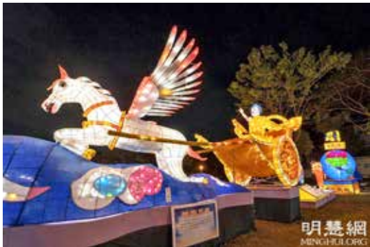
■ 法轮功学员制作的《神驹天车》参加台湾元宵灯会。

汉明帝时，明帝为了弘扬佛法，下令正月十五夜，不论士族庶民，一律“燃灯敬佛”，以示对神佛的尊敬和虔诚。此后，正月十五夜燃灯的习俗随着佛、道文化的影响扩大逐渐在中国扩展开来，历朝历代都以此为一大盛事。