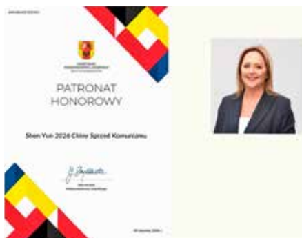
■ 罗兹省长斯克兹德鲁斯卡女士褒奖神韵艺术团。

就展现了中国文化。所以我一定会认真阅读这本书，以了解更多信息，并深入了解这些故事的背景。”