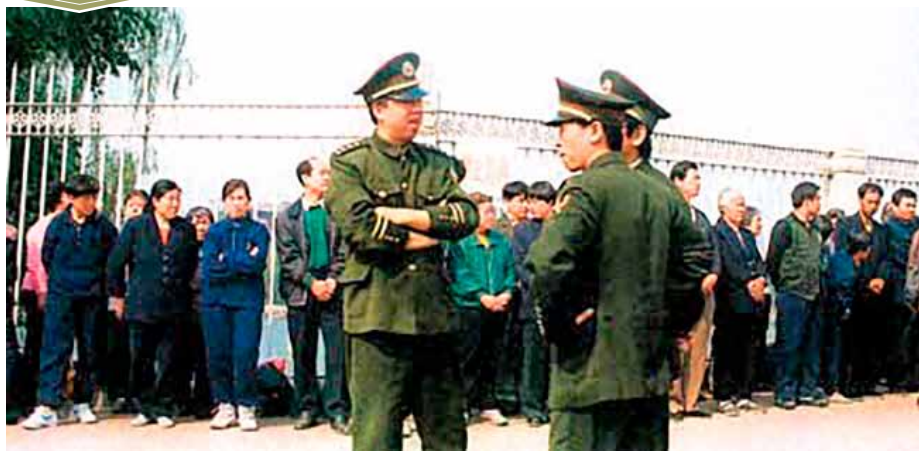
■ 逾万名法轮功学员到北京和平上访历史图片。