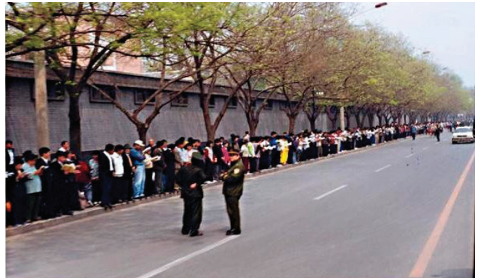
▲1999年4月25日，一万余名法轮功学员来到中南海旁边的国务院信访办和平上访。

如今中共迫害法轮功已经走进了第二十七个年头。二十七年来，每年纪念“4·25”，都有法轮功学员陆陆续续地把那天自己经历的、看到的令人感动的场面分享出来，唯独这个来自高层的详细爆料第一次见到。之前我想象不到，江泽民曾经有这样一个凶残的屠杀计划。随后我才注意到，很多回忆文章中都提过，基