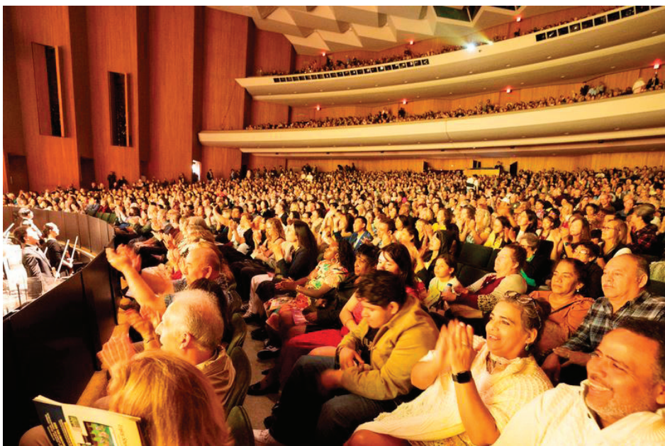
▲2月6日晚，神韵在美国长滩会展娱乐中心露台剧院的演出爆满。

她说：“整场演出令我惊叹不已、充满敬佩之情。你可以看到像纯洁、精准、自律、优雅等理念，都以非常美的方