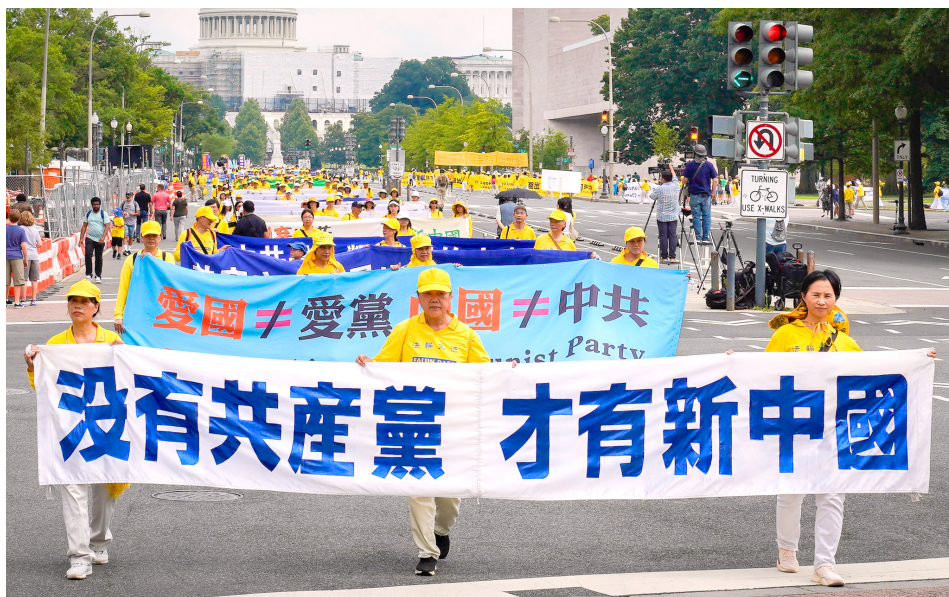
▲ 2023年7月20日，法轮功学员在美国首都华盛顿DC大游行。