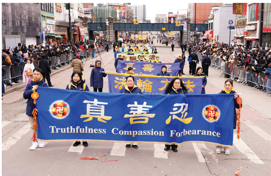
▲2月21日大年初五，法轮功学员参加纽约法拉盛中国新年游行。

大游行的意义在她看来，能使一些从中国大陆来的人看到人们在这里有自由表达的可能，“能在没有政党影响的情况下拥抱文化”。