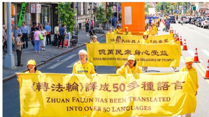
▲ 2025年7月20日，法轮功学员在曼哈顿华埠举行反迫害26周年大游行

制，并与团队一起寻找折衷做法。他不再急于分辨对错，而是专注于把事情做好。这样的改变，让同事与主管都感受到他的真诚，合作氛围也随之改善。