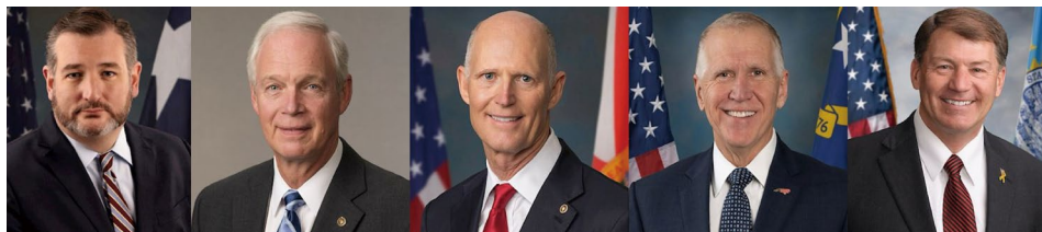
▲ 美国国会参议院《法轮功保护法案》(S.817) 其中五位提案人

布朗巴克最后表示：“世界上存在一个由黑暗国家组成的轴心——共产主义、极权主义、威权主义国家——它们反对并压制宗教自由。我们必须清楚地指出这一现实，坚定站出来反对，并持续推动全球宗教自由。”