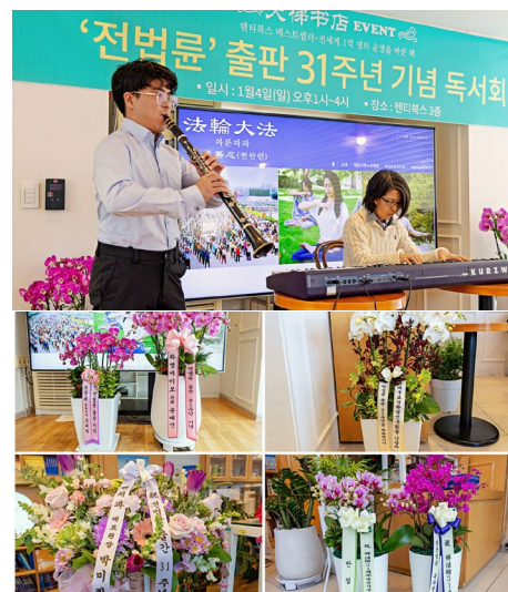
▲ 活动中演奏《得度》《为你而来》乐曲，法轮功学员赠送祝贺花篮

本次活动再次展现了《转法轮》对人们人生的深远影响。现场不时响起欢笑与惊叹声，许多参与者表达了对结缘这本书的深深感恩。■