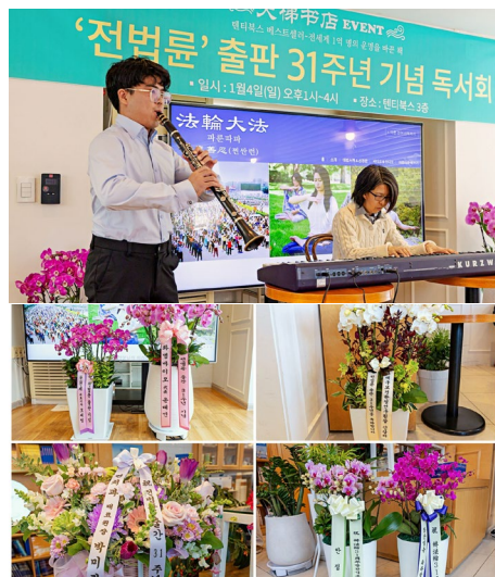
▲ 活动中演奏《得度》《为你而来》乐曲，法轮功学员赠送祝贺花篮

本次活动再次展现了《转法轮》对人们人生的深远影响。现场不时响起欢笑与惊叹声，许多参与者表达了对结缘这本书的深深感恩。■