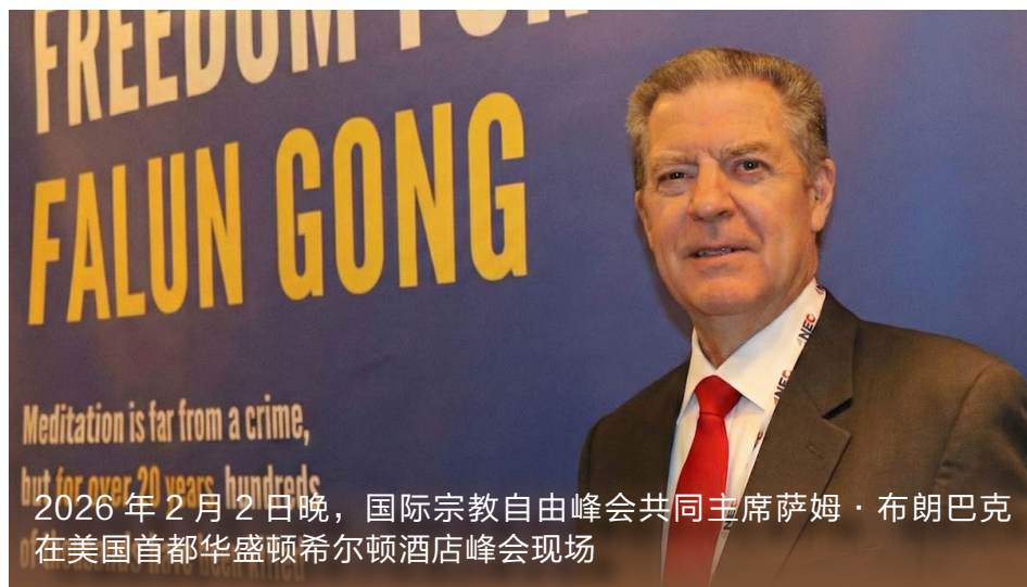
2026年2月2日晚，国际宗教自由峰会共同主席萨姆·布朗巴克在美国首都华盛顿希尔顿酒店峰会现场