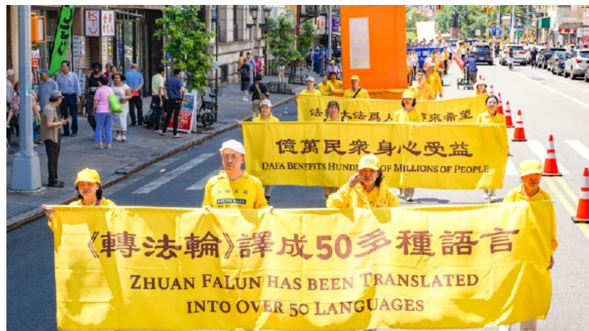
▲ 2025年7月20日，法轮功学员在曼哈顿华埠举行反迫害26周年大游行

制，并与团队一起寻找折衷做法。他不再急于分辨对错，而是专注于把事情做好。这样的改变，让同事与主管都感受到他的真诚，合作氛围也随之改善。