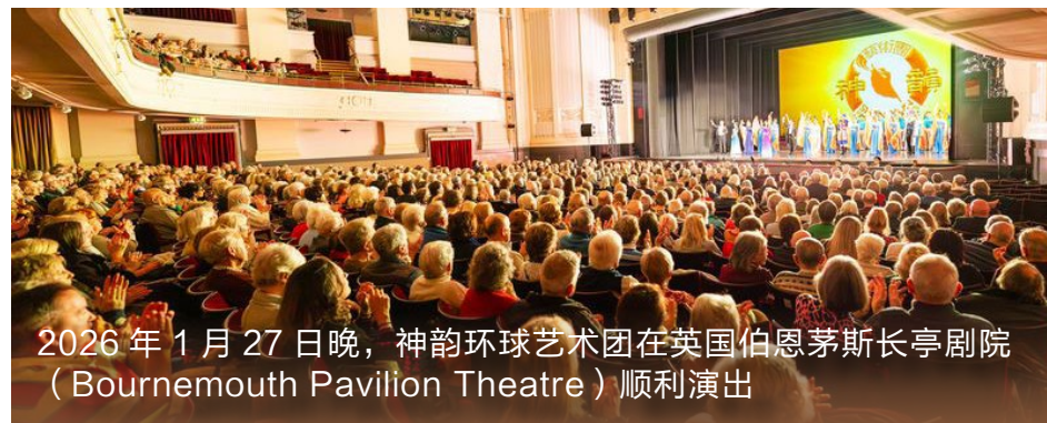
2026年1月27日晚，神韵环球艺术团在英国伯恩茅斯长亭剧院（Bournemouth Pavilion Theatre）顺利演出