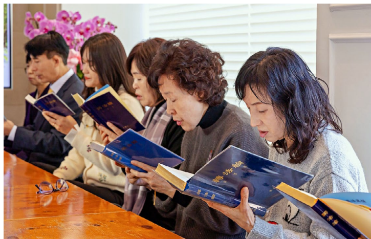
▲ 与会者一起读《转法轮》