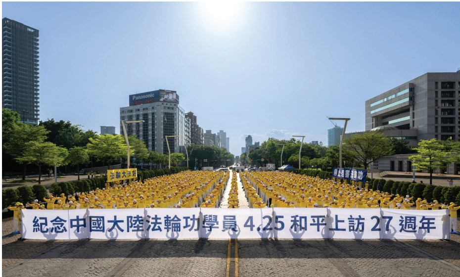
▲ 4月19日，法轮功学员在台北市府广场前集体炼功。

今年是法轮功学员“4·25万人大上访”27周年，世界各地的法轮功学员都在以不同方式，纪念这个特别的日子。