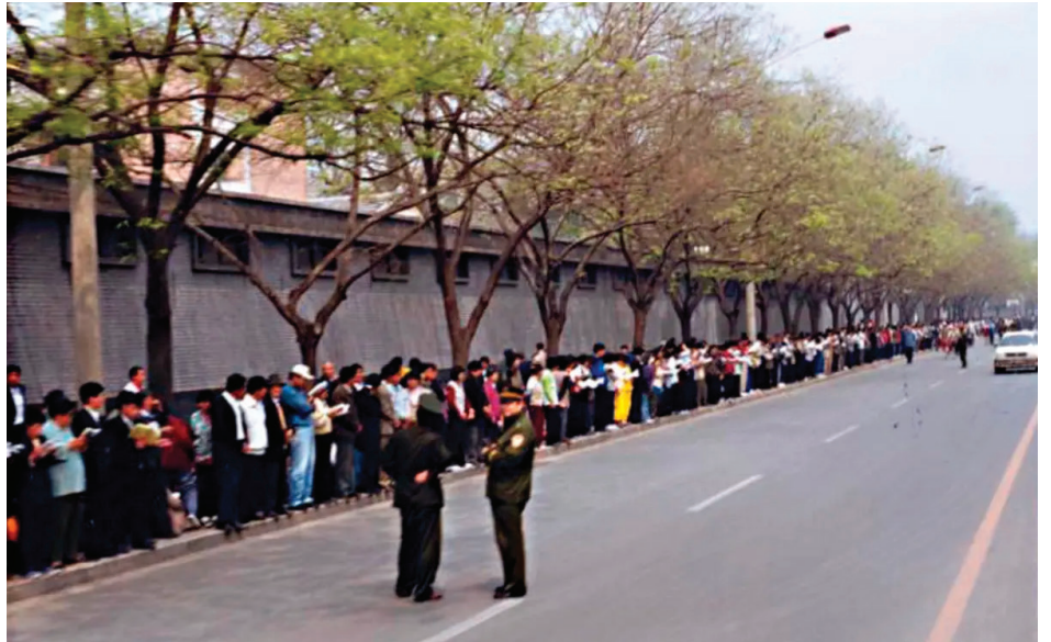
▲ 1999年4月25日，万名法轮功学员在北京信访办和平请愿。（明慧网）

其一，炼功点的口耳相传：当时全国几乎每十个人中就有一个人在学炼法轮功，各地都有晨炼的“炼功点”。天津事件发生后，相关的抓捕消息和“天津不放人，让去北京反映情况”的消息，通过辅导员（义工）或学员在早晨炼功