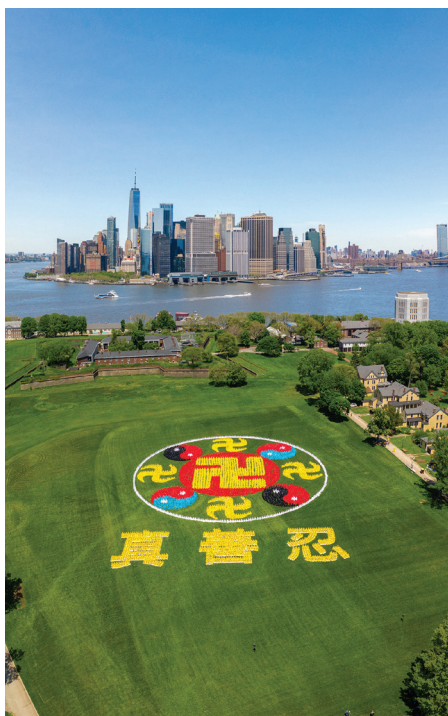
▲ 2019 年 5 月 18 日，法轮功学员五千人在纽约总督岛公园排出法轮图形和“真善忍”三个字。

大约下午 4、5 点钟，新华门那里喧闹起来，能清晰地听到人们热情的招呼：朱总理！也听到了朱身边的工作人员说：“不能都聚在这里，派几个代表里边谈谈。”有人高