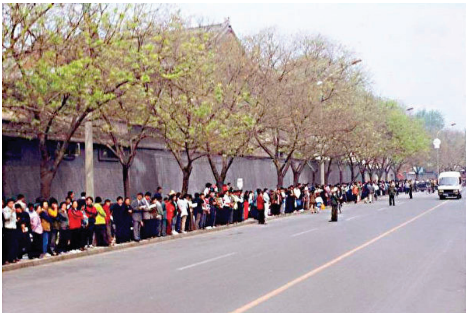
▲ 1999 年 4 月 25 日，万名法轮功学员在北京信访办和平请愿。（明慧网）

25 日大约上午 8 点左右，我们在长安街下了车，居然有警察引领我们来到了新华门的红墙之外，陆陆续续来的大法弟子们很有秩序地站好，在人行道上，规规矩矩地站在马路牙子以内，人群大约站了三四行。在这里，我看到了我的父母，他们和自己炼功点的几个同修站在一起。我们谁都不大声喧哗，（虽然扯开嗓门讲话，是我们大部份农村人的生活习惯），大家交流低声细语。有陌生的同修提醒：年轻人站在最前面，老年同修累了可以在后面坐坐，大家不要双手叉腰，也不要抱在胸前（有对抗的意思）……我们自觉把这些提醒扩散出去。