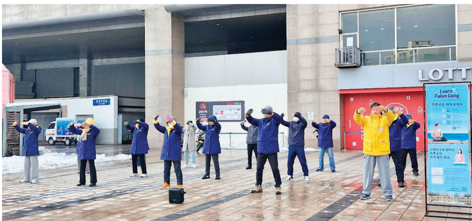
▲ 韩国法轮功学员在真相点集体炼功

来，他们不仅发放了海量的韩语资料，更针对往来于此的中国游客和留学生，准备了大量中文真相册子，帮助无数人破除了中共谎言的影响。