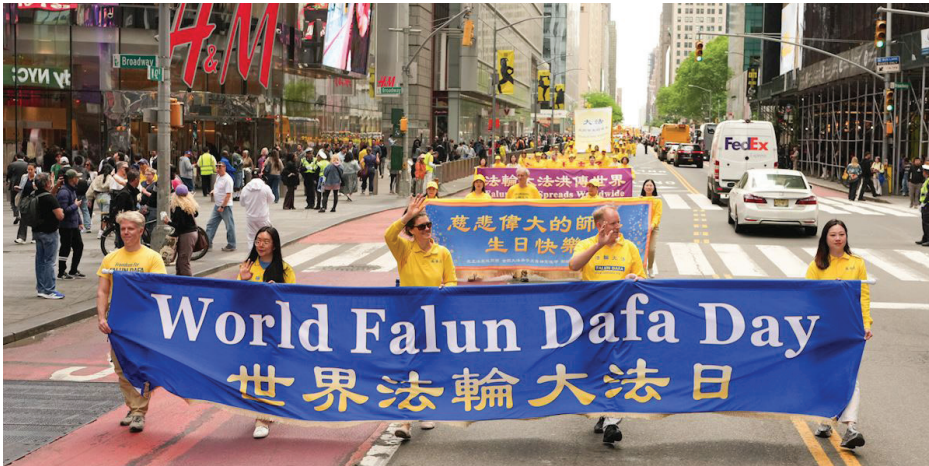
▲ 5月13日，大纽约地区部分法轮功学员在纽约曼哈顿举办盛大游行。

5月13日是世界法轮大法日，也是法轮功创始人李洪志大师华诞。34年前的这个日子，法轮大法开始洪传于世，“真、善、忍”的准则传遍全球五洲四海，福泽亿万人的身心。