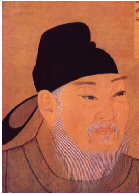
清宫殿藏本法官典范狄仁杰画像。