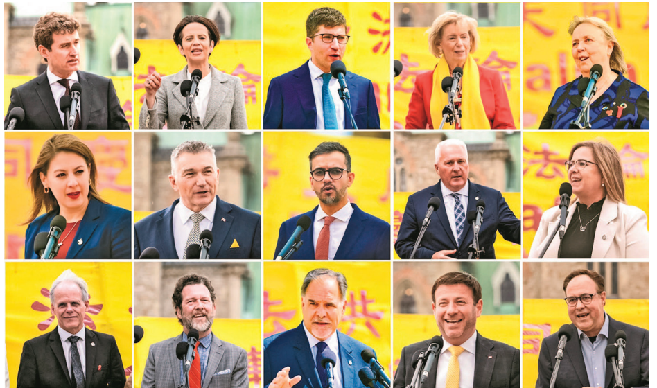
▲ 5月5日，加拿大国会议员和法轮功学员共同庆祝法轮大法日。

她感谢活动主办方把大家凝聚在一起，并“持续推动反思、慈悲与尊重的理念”。她说，“这关乎人权。我们必须团结一致，确保在这个充满