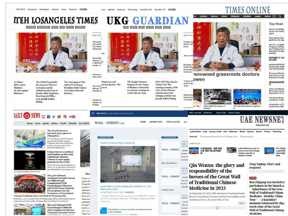
▲ 这些虚假新闻网站抄袭设计元素，冒充美国主流媒体（大纪元）

在上述虚假新闻网站的基础上，中共还在海外社交媒体平台上设立虚假的自媒体账号，用来加强海外渗透、更全面地向海外宣传中共政权的专制言论。■