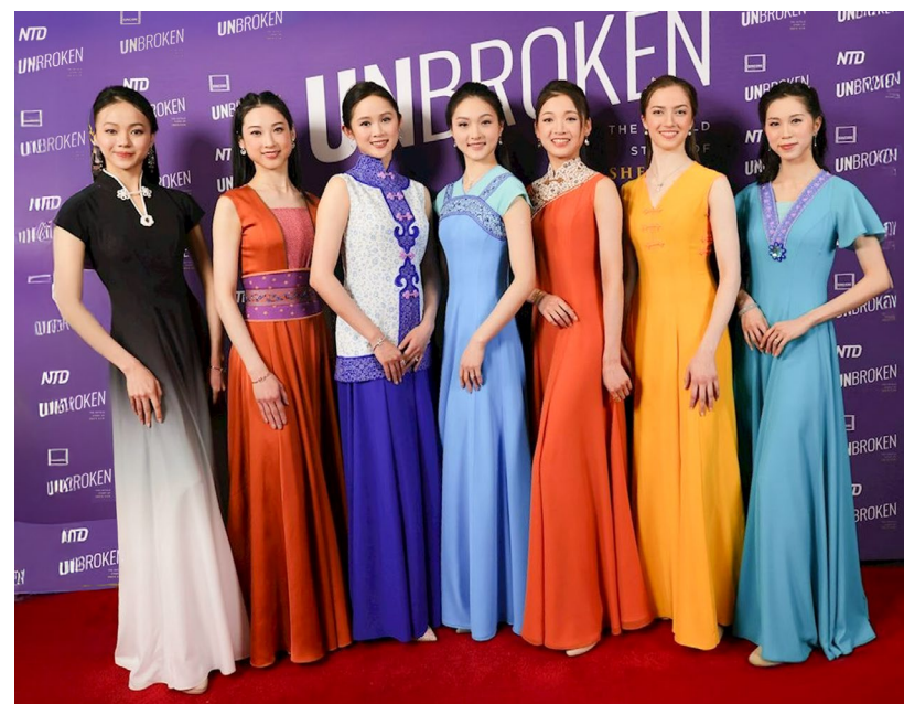
▲ 2026年3月24日晚，7位神韵艺术家身着由神韵艺术总监 D.F. 先生亲自设计、取材于中国不同朝代风格的礼服，莅临首映式前的隆重红毯欢迎仪式。（神韵作品）