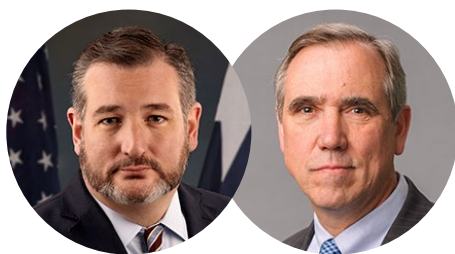
▲ 特德·克鲁兹和杰夫·默克利

克鲁兹参议员在声明中说：“中共运作着一个残酷的、国家支持的活摘器官产业，专门针对不同信仰的人。中共尤其针对法轮功学员，