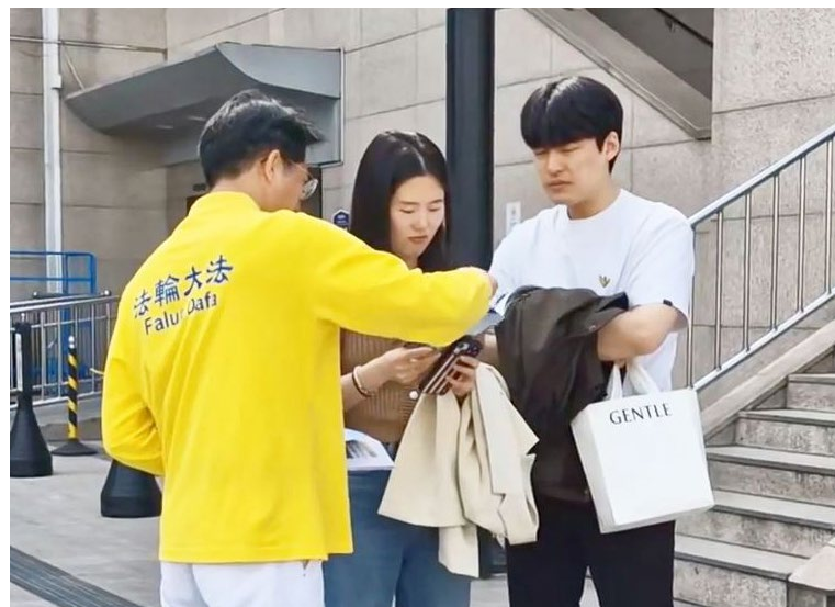
◀ 法轮功学员每周末坚持在水原站向过往行人发真相传单

报告的作者指出，参与中共统战“精心培育”网络的各种公民协会种类繁多。他们推广的目标包括“讲好中国故事”、“作为中国与世界之间的桥梁”和“中华民