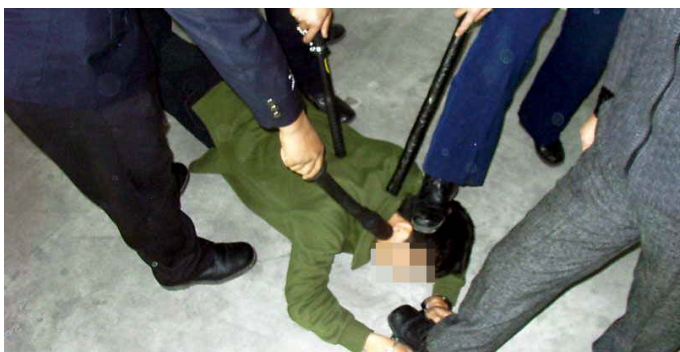
▲ 法轮功学员遭迫害酷刑（演示图）

明慧网还有多篇石家庄市桥东公安分局、裕华公安分局警察绑架、迫害当地法轮功学员的报导。