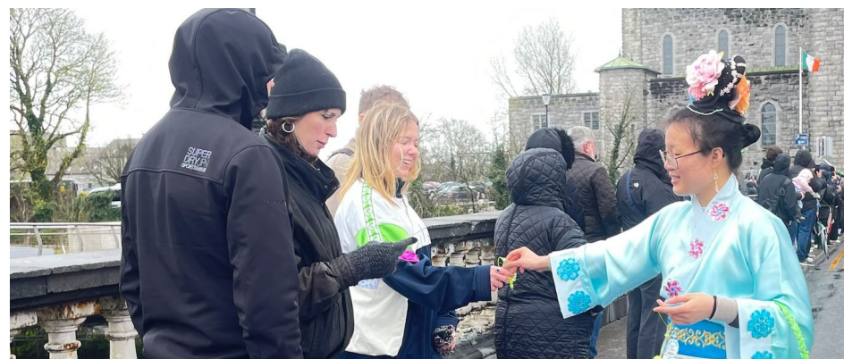
▲ 爱尔兰法轮大法学会参加高威古城国庆节大游行

3月17日上午9点多，艾尔广场、高威主教教堂等游行沿线已聚集了人群，不少游客头戴绿色高帽、身穿印有三叶草图案的绿色服饰等候游行开始。据当地媒体估计，现场观众超过3万人。