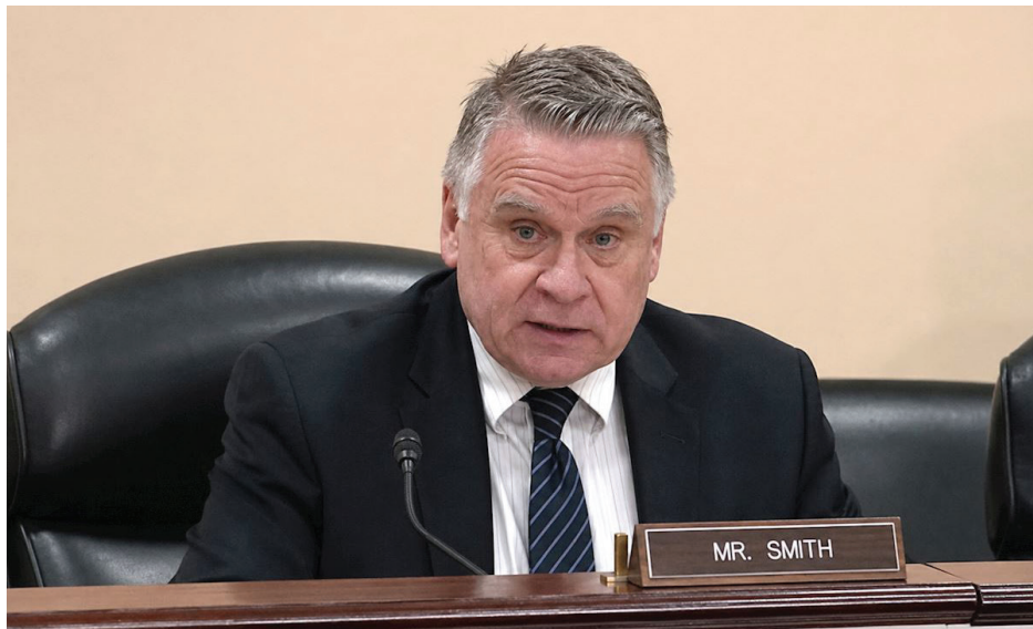
▲ 美国国会议员、中国委员会共同主席克里斯·史密斯。

【明慧网】5月14日，美国国会及行政当局中国委员会（CECC）就中共活摘器官问题举行听证会。与会者严厉谴责中共针对法轮功学员、维吾尔人及其他良心犯实施活摘器官的罪行，并呼吁美国及国际社会组成全球联盟，共同制止这一“现代世界中不应存在的暴行”。