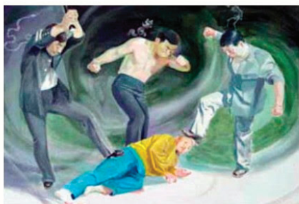
中共酷刑示意图：殴打