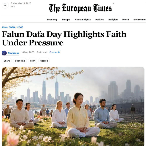
▲《欧洲时报》刊文介绍世界法轮大法日。

1999 年，中共开始全面迫害法轮功，并长期将这一信仰群体视为对政权的威胁。也正因如此，世界法轮大法日的庆祝方式形成鲜明对比：在许多民主国家，学员可以公开集会、自由炼功；而在中国大陆，许多修炼者可能面临严重风险，只能低调甚至秘密纪念这一日子。这样的反差，使 5 月