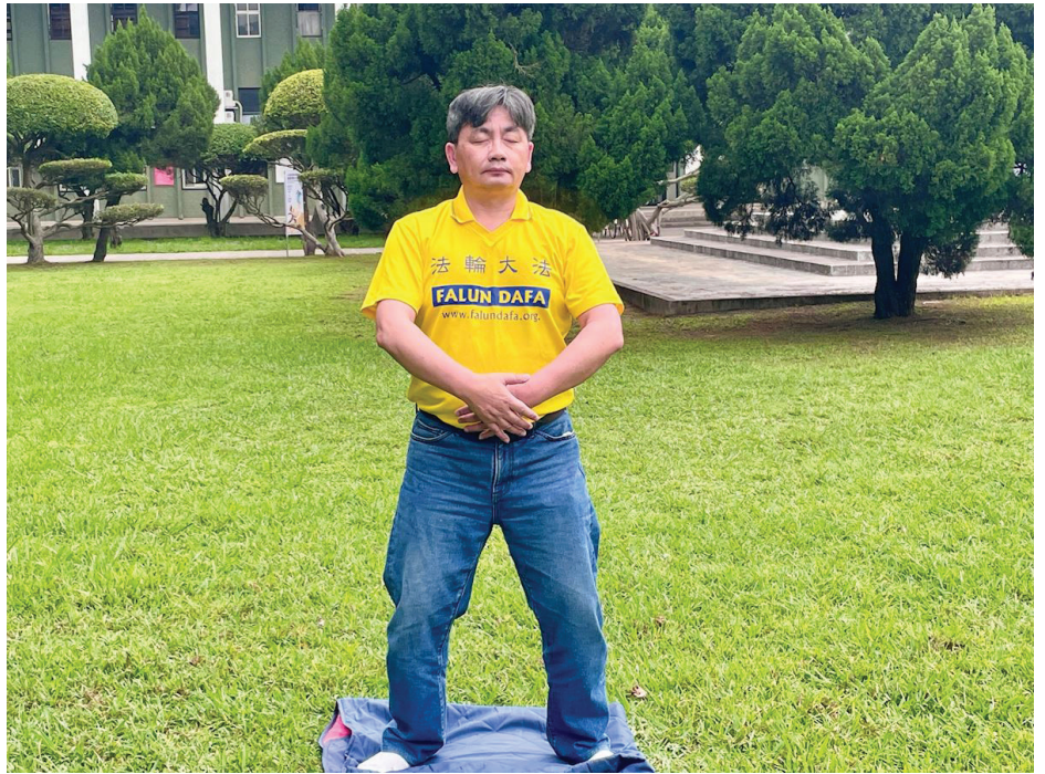
▲ 祥富在炼功后，身心发生很大的变化。