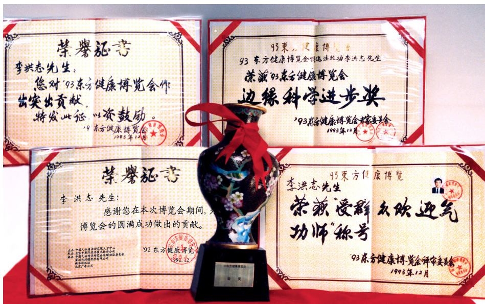
▲ 1993年12月11日至12月20日李洪志先生再次率弟子以博览会组委会成员身份参加北京1993年东方健康博览会,获博览会最高奖“边缘科学进步奖”和大会“特别金奖”及“受群众欢迎气功师”称号。

处事的准则,与法轮功“真、善、忍”的要求,有天壤之别。从此,我严格按照师父要求弟子做好人中的好人的标准要求自己,从最小的方面开始改变自己。