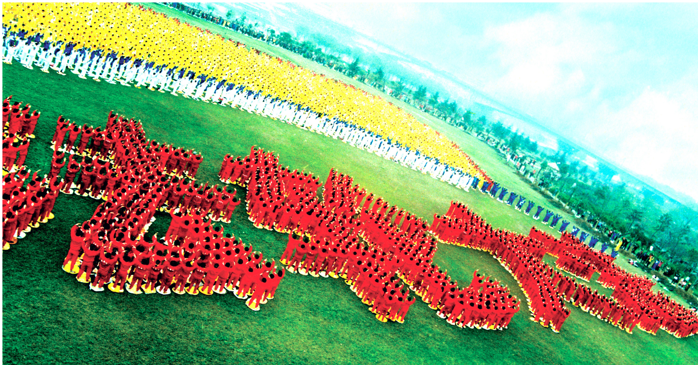
▲ 1999年3月27日，近万名法轮功学员在武汉市汉阳区汉水公园炼功排字。