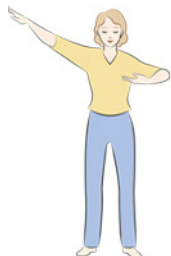
第一套功法 佛展千手法

弘传世界 法轮大法弘传100多个国家和地区。李洪志先生和法轮大法因对人类身心健康的杰出贡献，获各国政府褒奖、支持议案和信函逾万项。