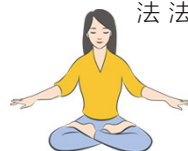
第五套功法 神通加持法