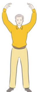
第二套功法 法轮桩法