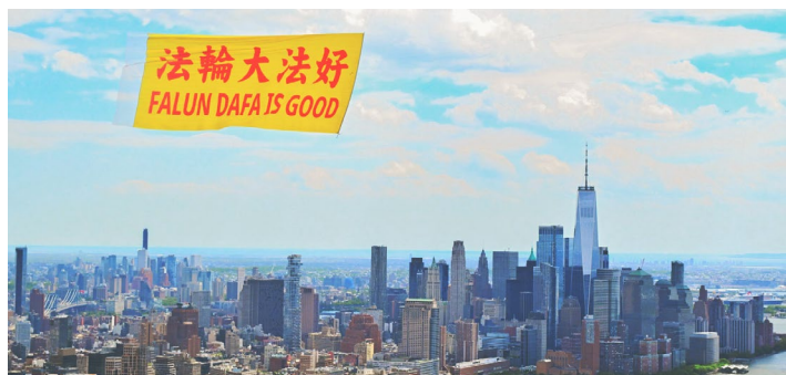
▲ 庆祝5月13日世界法轮大法日，5月8日法轮功学员在纽约上空放飞一幅巨型黄底红字的“法轮大法好”横幅