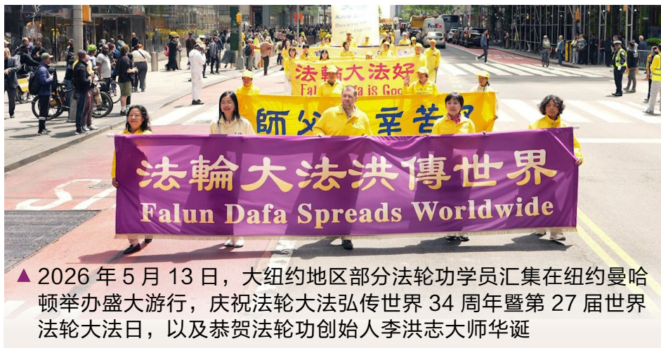
▲ 2026年5月13日，大纽约地区部分法轮功学员汇集在纽约曼哈顿举办盛大游行，庆祝法轮大法弘传世界34周年暨第27届世界法轮大法日，以及恭贺法轮功创始人李洪志大师华诞