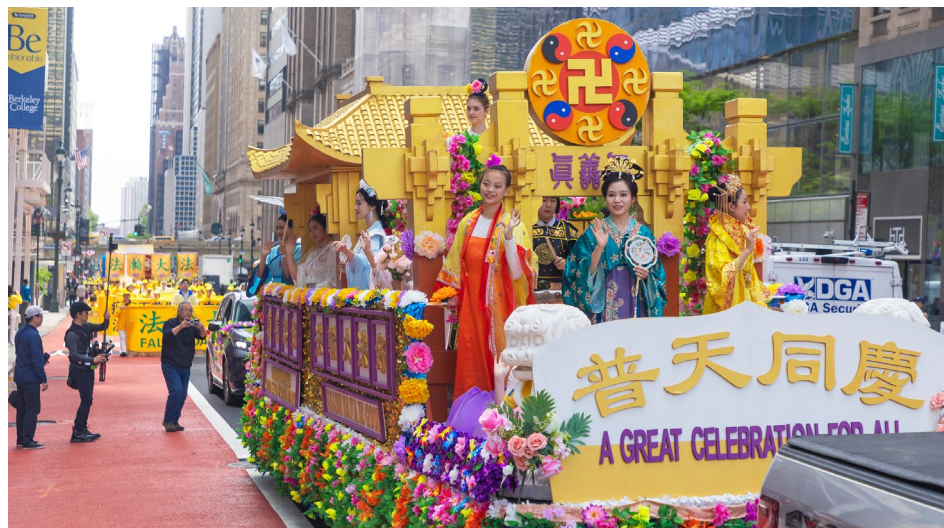
2026年5月13日，近两千名法轮功学员在纽约市曼哈顿举行“5·13世界法轮大法日”盛大游行活动