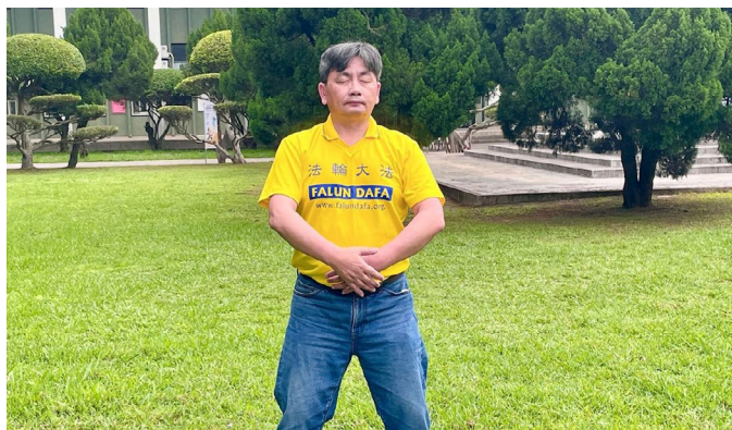
▲ 祥富在炼功后，身心发生很大的变化

“我常感觉到一股细微却有力的能量，像风一样一阵阵掠过，仿佛在清理身体周围的某种物质。”他描述道，“还有一次，我感觉许多气泡不断升起，每个气泡里像包裹着一个尚未成形的念头，还没发展就被带走，这些泡泡越来越少，然后消失不见，最后渐渐归于平静。”