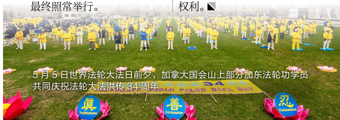
5 月 5 日世界法轮大法日前夕，加拿大国会山上部分加东法轮功学员共同庆祝法轮大法洪传 34 周年

5 月 5 日，在加拿大国会山举行的“世界法轮大法日”庆祝活动中，19 位加拿大会议员到场声援。多位议员在发言中公开反对中共对加拿大社会、文化与信仰自由的干预，并呼吁政府采取更明确措施，维护加拿大的主权与公民权利。■