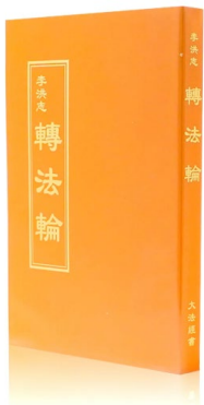
▲ 法轮大法书籍《转法轮》

在琳琅满目的书架间，他的目光被一本金黄色封面的书吸引——《转法轮》。他拿起来翻阅了几页，又放回原处，继续寻找其他书籍。然而，结果却出人意料：原本打算购买的书一本未取，反而再次拿起了那本刚刚放回去的《转法轮》。