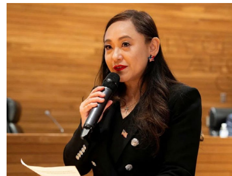
▲ 美国南加州华裔市长王爱琳