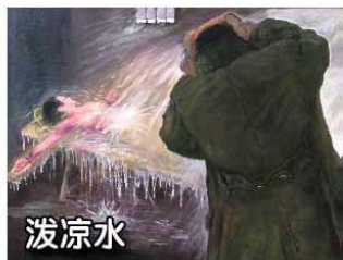
▲中共迫害法轮功酷刑图

上身挺直、双腿并拢并夹着一本书、双手放膝盖、不得动弹。并被威胁“书掉一次就电棍电击一次”。塑料凳有突起棱角，久坐皮肤会红肿、溃破、出血。