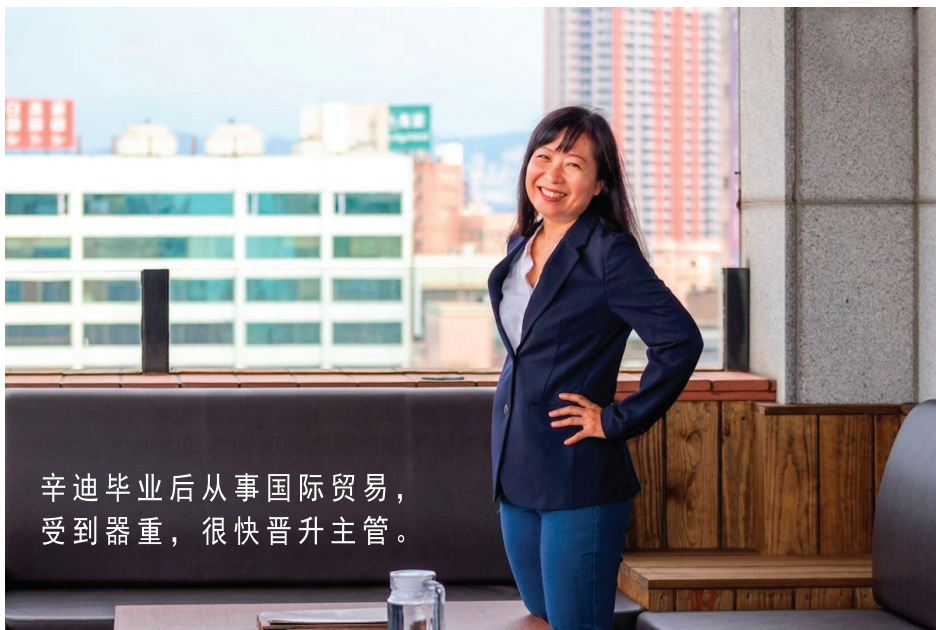
辛迪毕业后从事国际贸易，受到器重，很快晋升主管。

心，她从未告诉家人，努力在人前扮演一个“正常人”，把真实受伤的自己藏起来。“我好象分成两个人，一个是正常的我，一个是被伤害的我。”