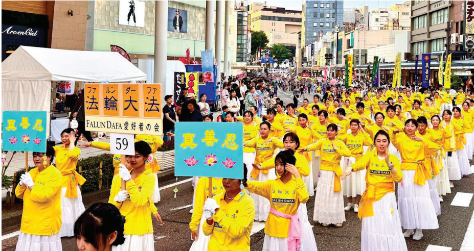
▲ 6月6日，日本法轮功学员参加石川县的“金泽百万石庆典”。

【明慧网】2026年6月6日，日本法轮功学员参加了在石川县金泽市举行的“金泽百万石庆典”。这是金泽市每年最大规模的传统庆典，通过游行、传统表演和历史人物扮演等活动，展现金泽的历史文化，每年吸引数十万市民和世界各地的游客前来观赏。