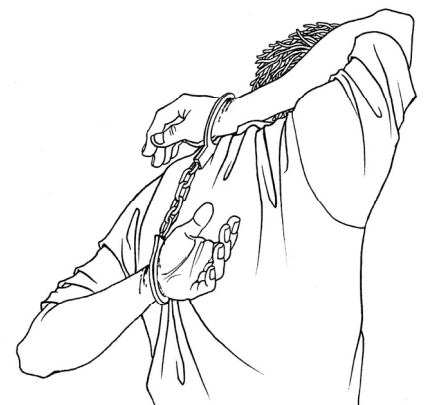
■中共酷刑示意图：背铐