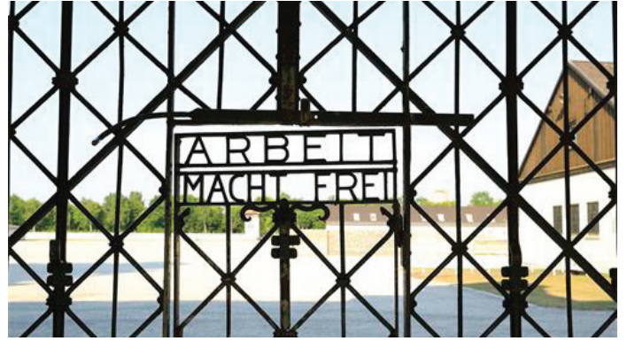
▲ 达豪集中营，德国纳粹建立的第一个集中营，位于德国南部达豪镇，距离慕尼黑 16 公里，曾先后关押过约 19 万人。

支持明慧网，分享明慧网信息，你就是在帮助传播公正的、正义的历史，减少人类的损失。（文：一言）