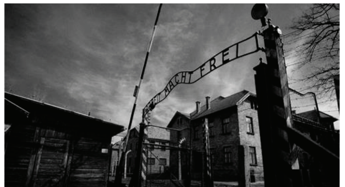
▲ 奥斯维辛集中营，德国纳粹在波兰南部小镇奥斯维辛建立的最主要的集中营和灭绝营，估计有 110 万人在此丧生。（iStock）