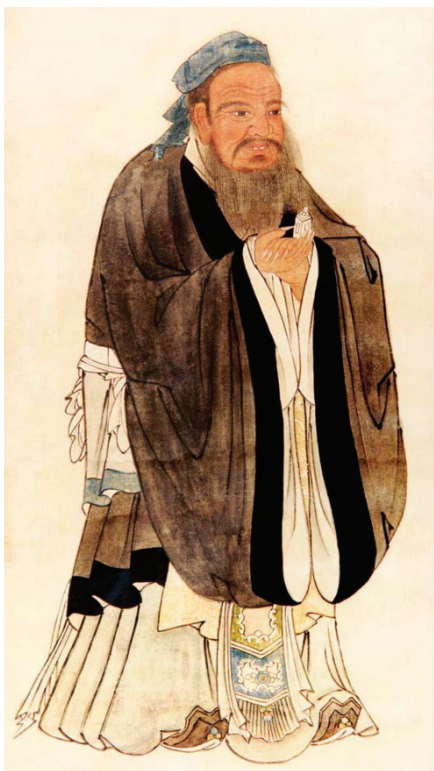
▲ 明代仇英所绘孔子像

【明慧网】在探讨儿女的终身大事时，现代父母往往看重学历、车房和家庭背景。然而，被誉为“万世师表”的孔子，在 2500 年前就用实际行动为我们示范了一种完全不同的择婿标准：不看标签，只看人品。