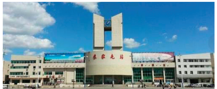
▲ 辽宁省沈阳市苏家屯车站。明慧网迄今已有 1800 多条首发消息，披露关于苏家屯地区迫害法轮功的罪恶。