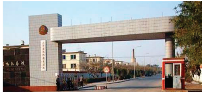
▲ 马三家教养院，中共用于迫害法轮功学员的主要设施之一。明慧网迄今已有 8600 多则首发消息或文章揭露此地罪恶的人与事。