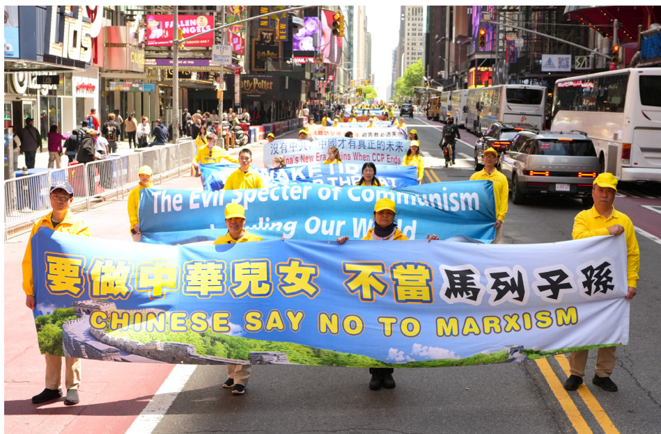
▲ 2026年5月13日,美国纽约法轮功学员在曼哈顿举行盛大游行,庆祝“世界法轮大法日”。