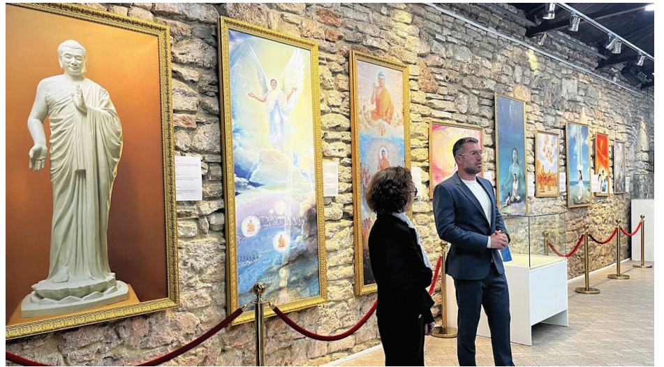
▲ 5月4日，“真善忍国际美展”在保加利亚巴尔奇克王宫开幕。

谐的氛围。虽然部份作品描绘了迫害的黑暗，但他认为艺术家更希望展现修炼者如何在磨难中获得升华。“正如那句谚语所说：‘穿越逆境，走向光明’，我认为这正是本次画展所传达的信息。”