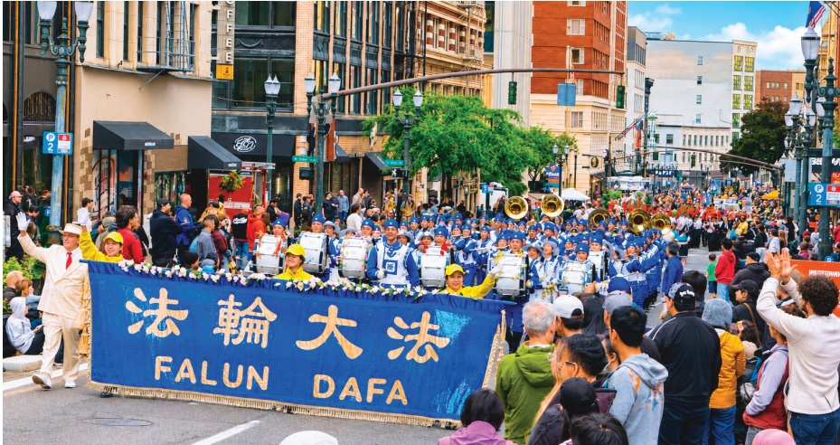
▲ 6月6日，天国乐团亮相波特兰玫瑰节星光游行。

【明慧网】2026年6月6日，法轮功学员组成的天国乐团和“大法船”花车再次应邀参加美国俄勒冈州波特兰玫瑰节盛大星光游行，这项一年一度的夏季盛事，深受当地民众喜爱，吸引大批观众沿途观赏。其中，“大法船”花车荣获“最佳非商业花车总指挥奖”。