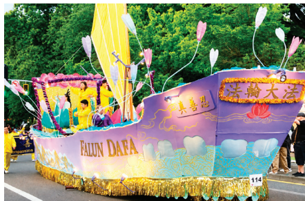
▲ 法船花车亮相游行。

夜幕下，由法轮功学员制作的大型“法船”花车再次成为星光游行的焦点，花车以紫色为主色调，搭配中国传统山