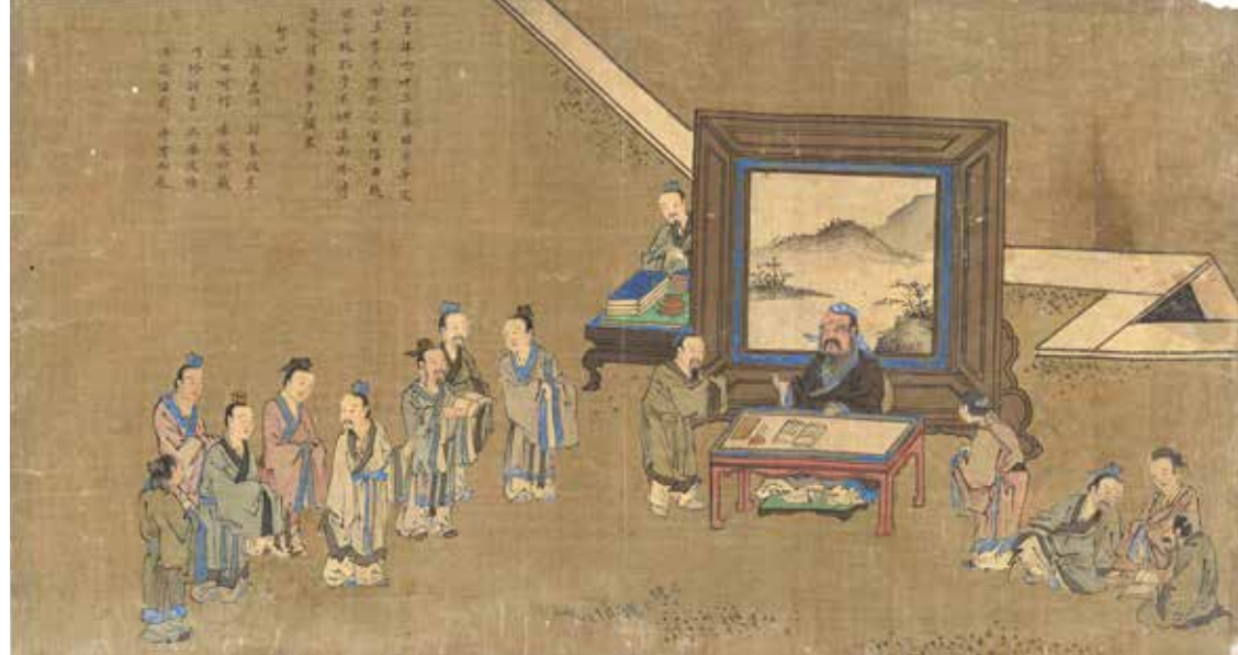
■ 明代画家仇英绘制的《孔子圣迹图》局部。（公有领域）