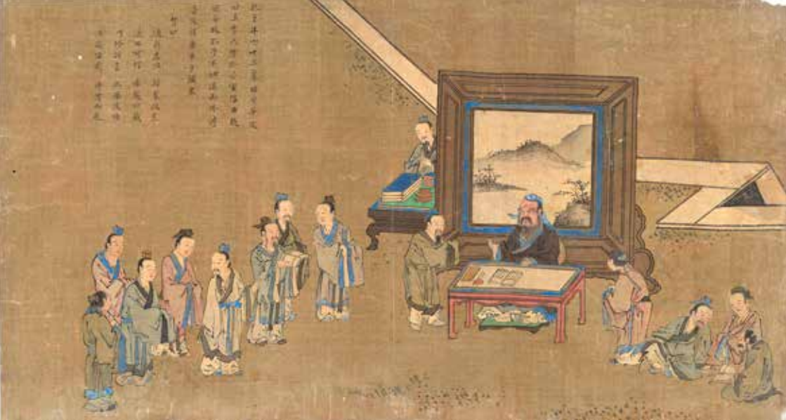
■ 明代画家仇英绘制的《孔子圣迹图》局部。（公有领域）