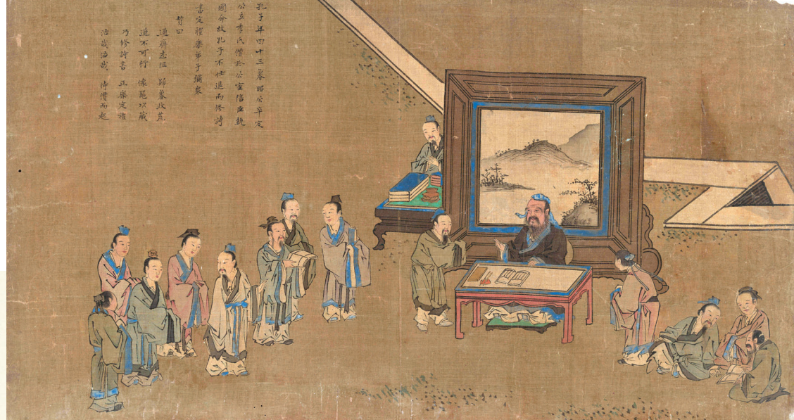
■ 明代画家仇英绘制的《孔子圣迹图》局部。（公有领域）

志明四十岁的时候，两次遇到了生死大难。他是电工，有一天高空作业时，电线杆突然连人带杆倒下来，志明把头偏向电线杆倾倒的相反方向，避