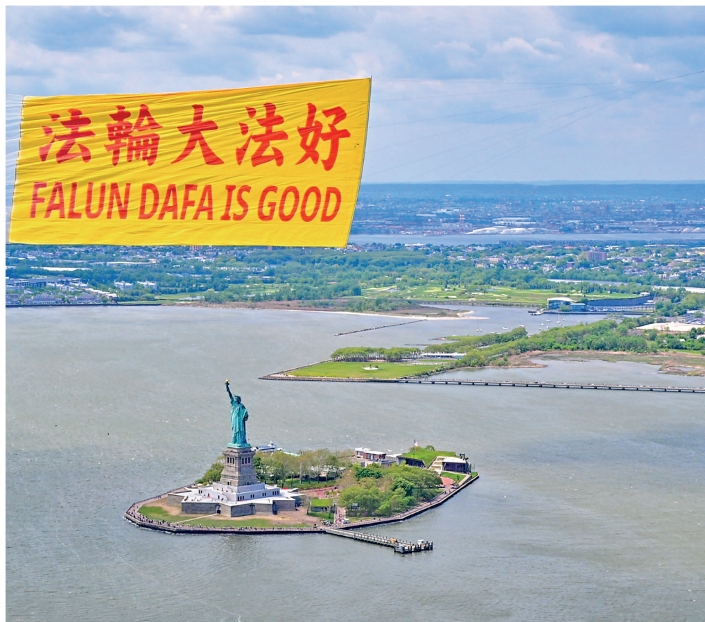
■ 世界各地庆祝“5.13 世界法轮大法日”。① 美国纽约法轮功学员在曼哈顿上空放飞巨型“法轮大法好”横幅。② 日本 ③ 韩国 ④ 英国。

她走了，我却像得了重感冒，全身每个骨头节都像被刀割一样疼。因为看了《转法轮》，知道了一些理，我就想：“说不定是师父给我净化身体呢。如