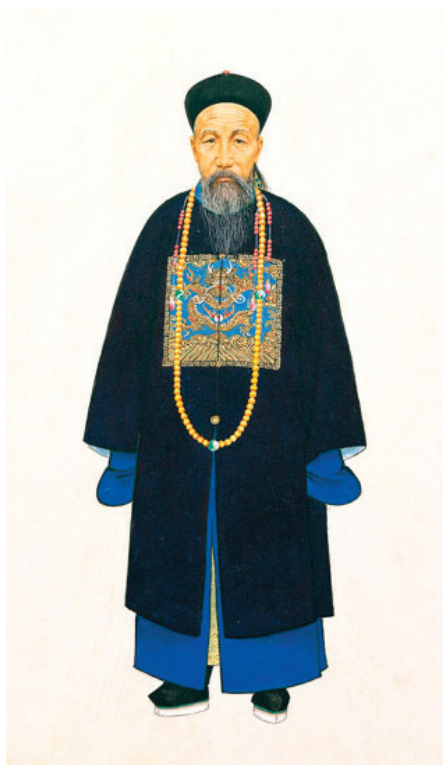
▲ 曾国藩画像。

我们每个人都难免在背后议论人，所以吕蒙正知道人固有的这种嫉妒和轻慢。如果一旦知道了名字，心中就难免会产生“责人之心”，为了保