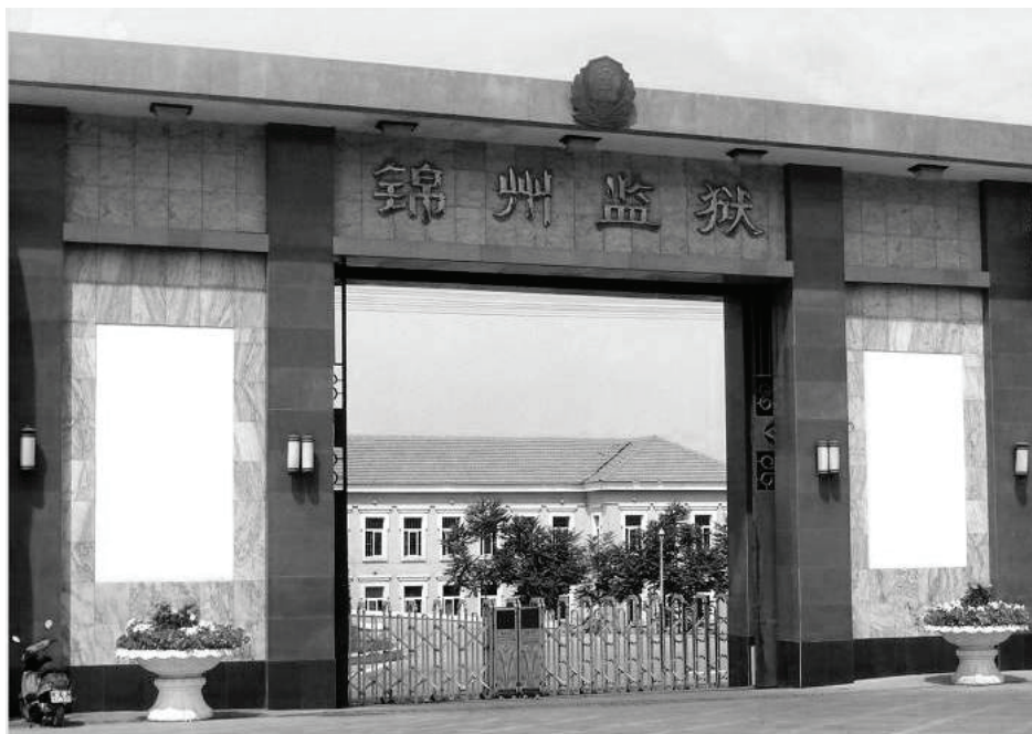
▲ 辽宁锦州监狱残酷迫害法轮功学员。