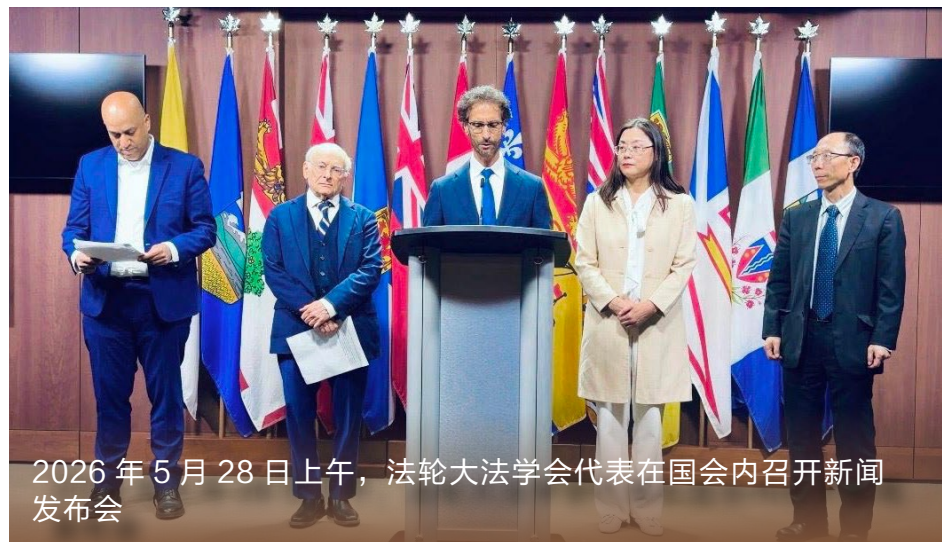
2026年5月28日上午，法轮大法学会代表在国会内召开新闻发布会

当一个人愿意按照真、善、忍去要求自己时，无论身处何地，心中都能拥有一片安宁而广阔的天地。■