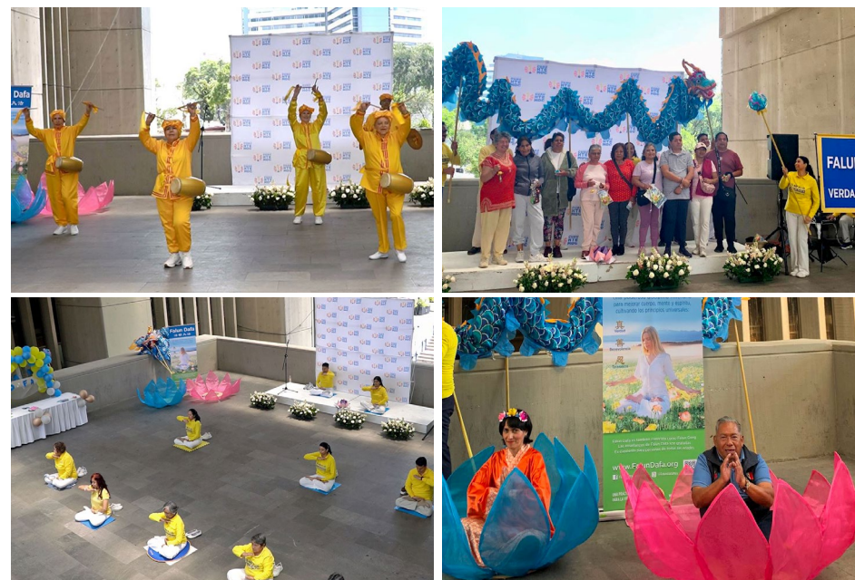
▲ 图上：法轮功学员的腰鼓表演 图下：墨西哥法轮功学员介绍法轮大法的活动

中国历史上不乏因制造冤案而臭名昭著的人物。秦朝宦官赵高以操控司法、陷害忠良闻名，最终在权力斗争中失败，被诛灭三族；唐代酷吏来俊臣发明酷刑、罗织罪名，一度深受武则天重用，却在政治局势变化后被处决；明代权宦魏忠贤借助特务系统打