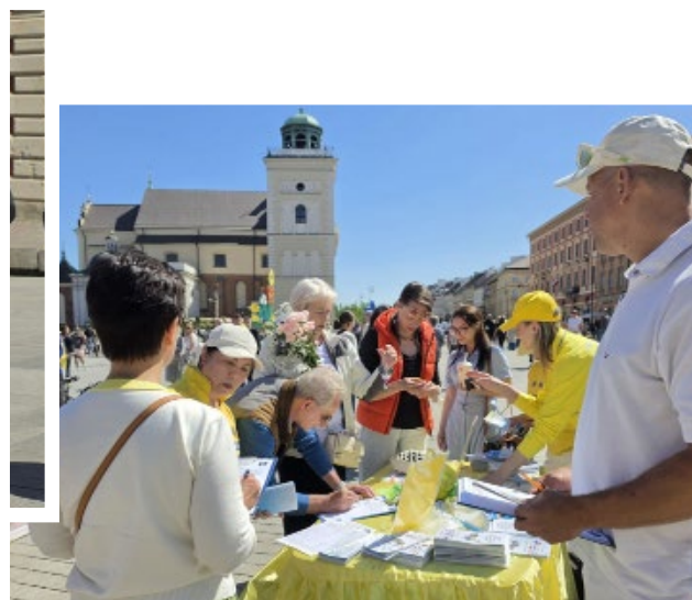
▲ 民众纷纷签名支持法轮功反迫害