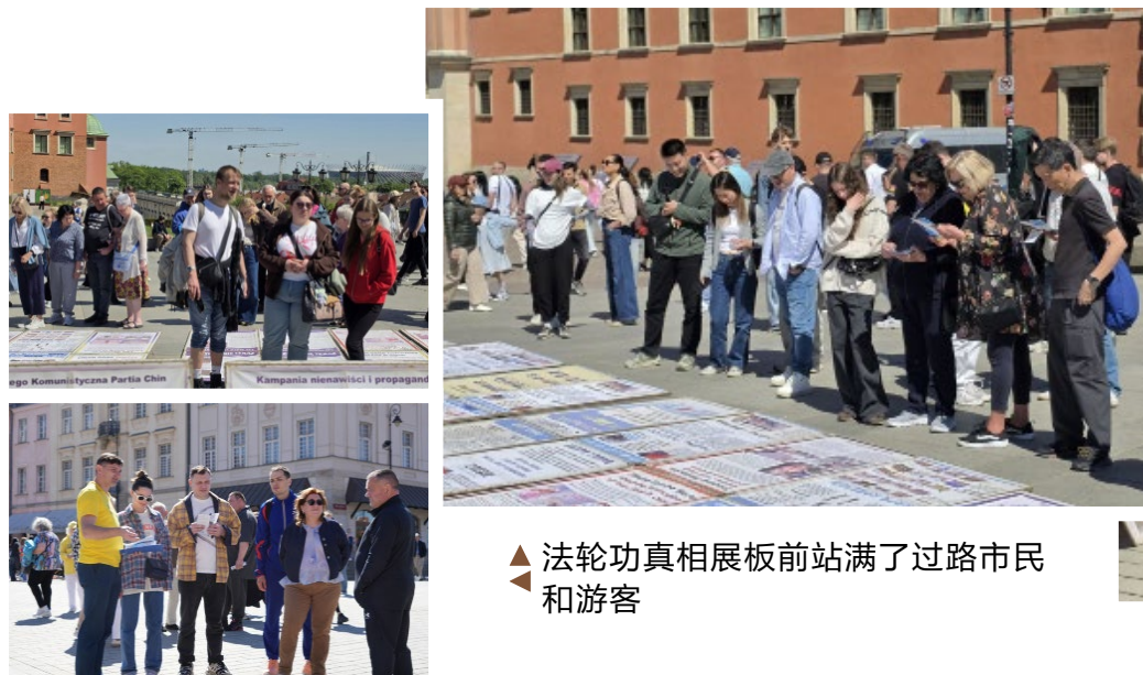
▲ 法轮功真相展板前站满了过路市民和游客

们讲述了中共活摘法轮功学员器官的罪行,以及有关“天安门自焚”、“四·二五上访”,也就是中共诬陷法轮功学员“围攻中南海”等事件的真相,并回答了她们提出的其他问题。当她们明白退出中共党团队(三退)保平安的真正意义时,仿佛如梦初醒,都对法轮功学员再三致谢,说:“总算搞清楚了,我们会上网了解更多真相,会让家中亲人都远离共产党”。