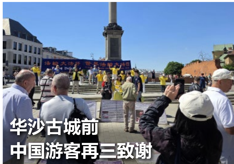
文 | 明慧波兰记者站报道

2026年5月10日，波兰和乌克兰部分法轮功学员在华沙古城举行活动，庆祝世界法轮大法日。当天阳光明媚，一扫此前连续数周的阴雨天气。活动现场吸引了许多游客驻足观看，不少来自大陆的游客也停下来阅读展板、观看法轮功学员炼功，并与学员交流。