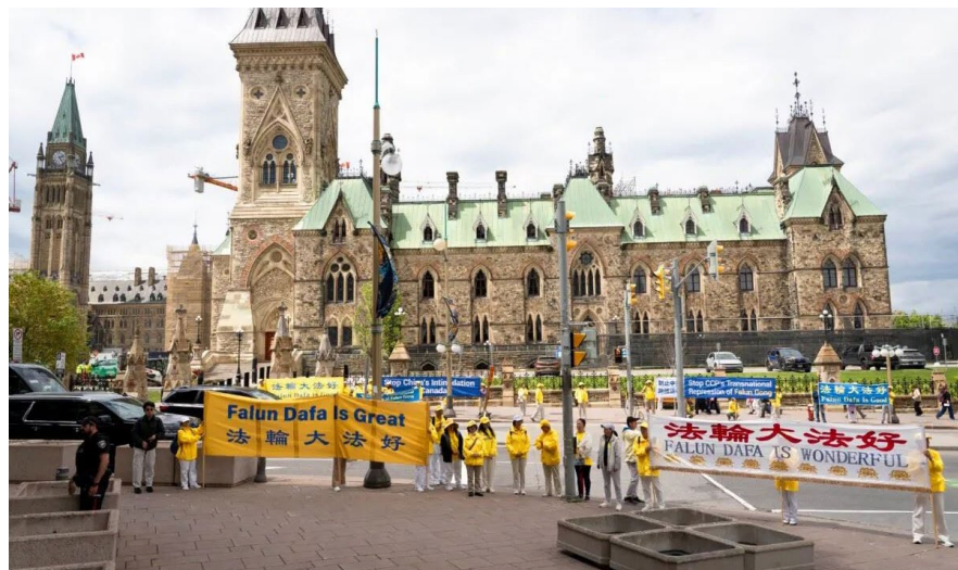
▲ 中共外交部长王毅访问渥太华期间，法轮功团体在国会山、外交部等地抗议中共迫害和跨国镇压

自5月28日起，加拿大法轮功学员分别在国会山、中国驻加拿大使馆等地点举行集会活动，抗议持续近27年的迫害以及跨国镇压行为，并呼吁加拿大政府采取更有力、更具体的措施，制止中共在海外不断升级的干扰和跨国镇压活动。■