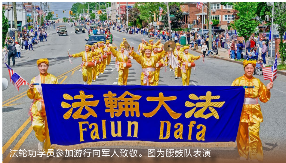
法轮功学员参加游行向军人致敬。图为腰鼓队表演