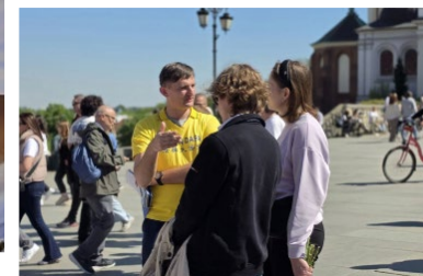
▲ 民众在向法轮功学员了解真相

交流过程中，法轮功学员问他们：“为什么在国外可以自由炼功，而在中国却不行？”一位游客低声说：“我们不谈政治。”话音刚落，另一位正在录像的男子接过话说：“不问政治的人碰到政治问你怎么办？人家法轮功就是有理，你看共产党什么时候讲过理，弄个天安门自焚，栽赃陷害法轮功，这个政治要不要讲？我看共产党迟早