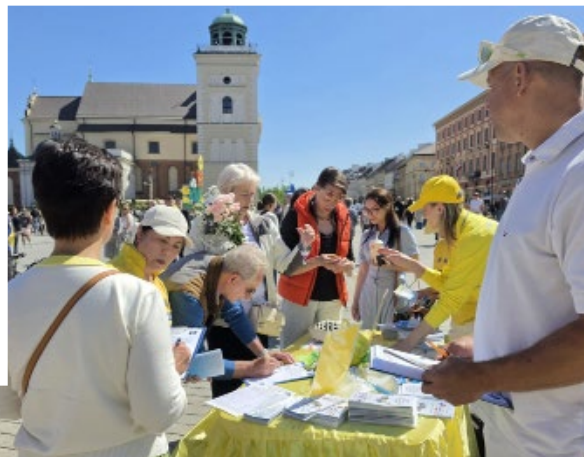
▲ 民众纷纷签名支持法轮功反迫害

活动期间,几位来自中国大陆的男士站在展板前,不停地用手机拍摄现场画面,还不时把镜头对准正在炼功的法轮功学员。其中一位男子笑着招呼同伴说:“快录下来,现在国内很多人都不知道法轮功是什么样的。你录下来,起码证明你真的出国了。”这句话引得周围的中国游客都笑了起来。