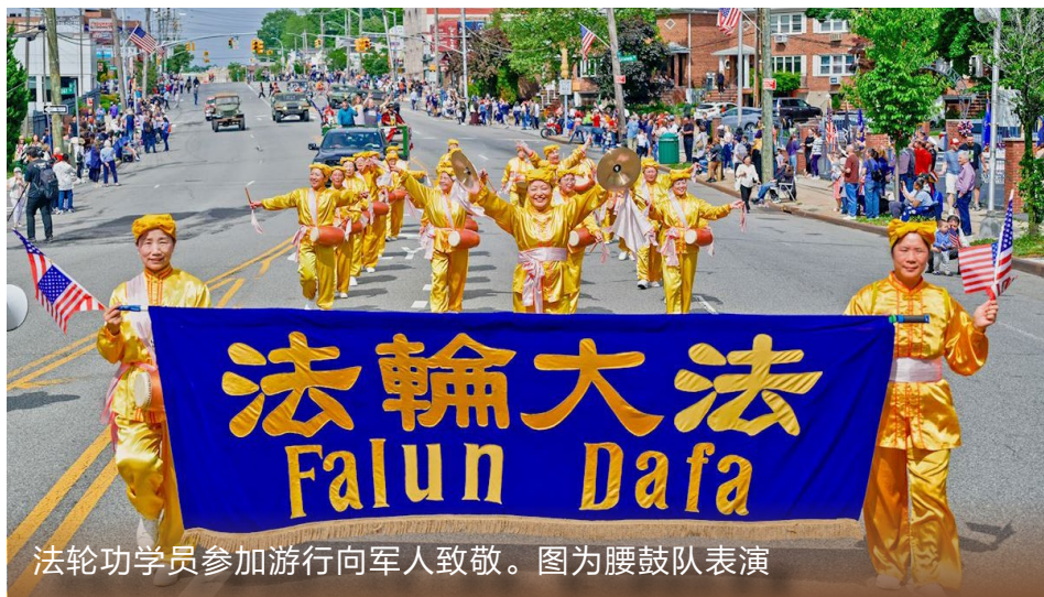
法轮功学员参加游行向军人致敬。图为腰鼓队表演