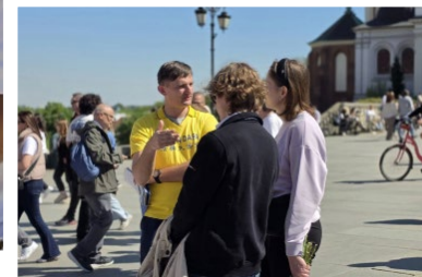
▲ 民众在向法轮功学员了解真相

交流过程中,法轮功学员问他们:“为什么在国外可以自由炼功,而在中国却不行?”一位游客低声说:“我们不谈政治。”话音刚落,另一位正在录像的男子接过话说:“不问政治的人碰到政治问你怎么办?人家法轮功就是有理,你看共产党什么时候讲过理,弄个天安门自焚,栽赃陷害法轮功,这个政治要不要讲?我看共产党迟早