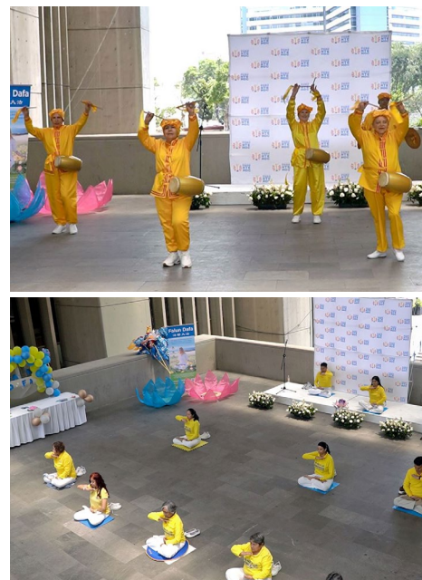
▲ 图上：法轮功学员的腰鼓表演 图下：墨西哥法轮功学员介绍法轮大法的活动

社会发展总监、前联邦众议员维罗妮卡·华雷斯·皮尼亚在区广场欢迎法轮功学员的到来。她赞扬法轮大法的原则以及学员们与居民的热情互动，并感谢他们主办有益社区的活动，让不同年