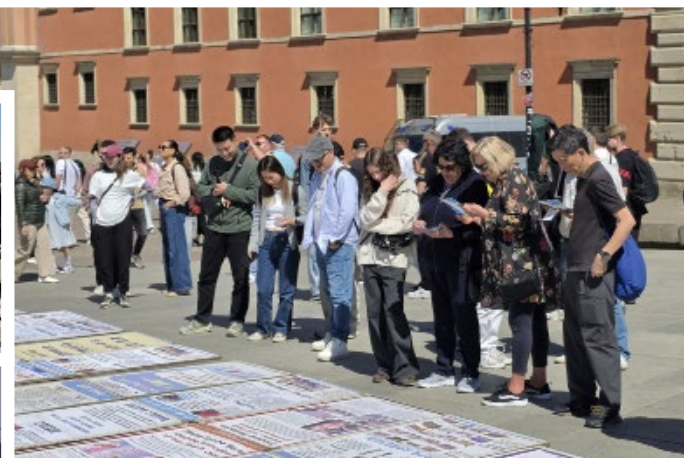
▲ 法轮功真相展板前站满了过路市民和游客

们讲述了中共活摘法轮功学员器官的罪行,以及有关“天安门自焚”、“四·二五上访”,也就是中共诬陷法轮功学员“围攻中南海”等事件的真相,并回答了她们提出的其他问题。当她们明白退出中共团队(三退)保平安的真正意义时,仿佛如梦初醒,都对法轮功学员再三致谢,说:“总算搞清楚了,我们会上网了解更多真相,会让家中亲人都远离共产党”。