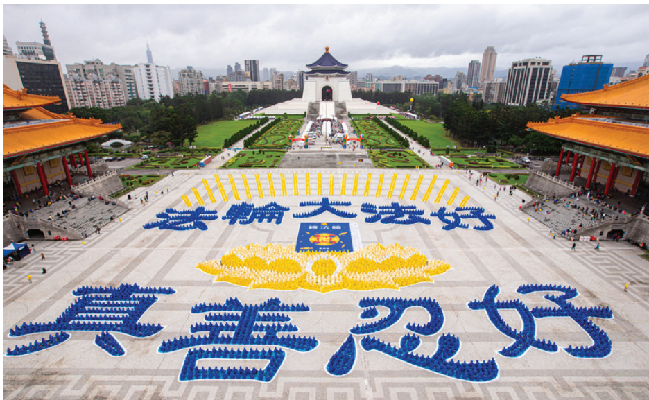
▲ 2020年12月5日，台湾法轮功学员排出“法轮大法好、真善忍好”。

我立即郑重地告诉他：“有办法！只要你相信就有办法，你就诚心默念法轮大法好！真善忍好！就一定会有转机！因为法轮大法是佛法，你信到什么程度，就能好到什么