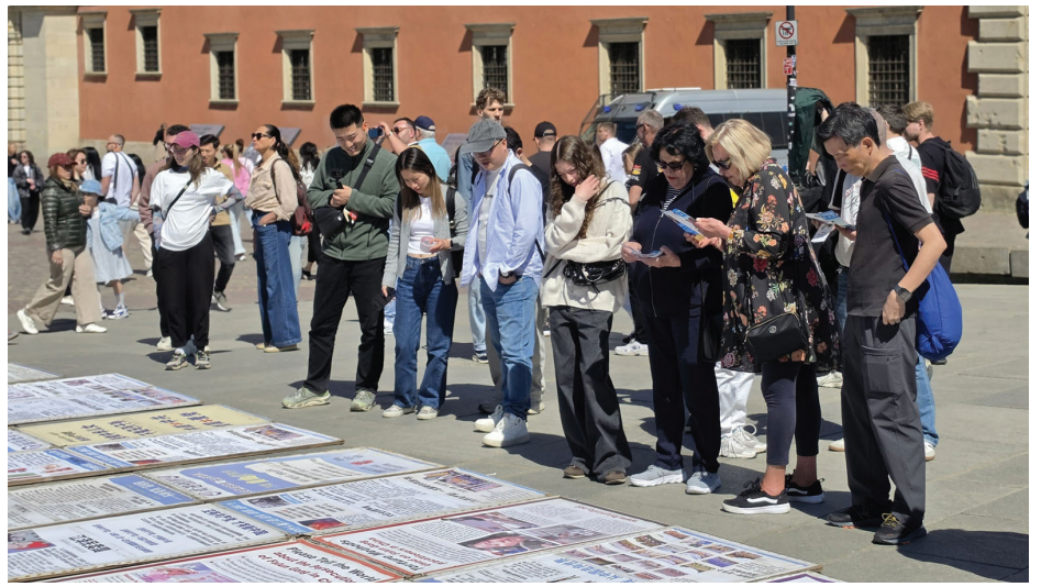
▲ 路过的数队中国人拍照或阅读法轮功真相资料。

地向她们讲述了“天安门自焚”真相，详细讲解了关于中共诽谤法轮功学员“围攻中南海”的真相，以及中共活摘法轮功学员器官的罪行。当她们明白“三退”保平安的真正意义时，仿佛如梦初醒，都对法轮功学员再三致谢，说：“总算搞清楚了，我们会上网了解更多真相，让家中亲人都远离共产党”。