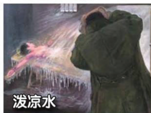
▲ 中共迫害法轮功酷刑迫害示意图

天岗派出所一名绰号“大原儿”的警察用卷成棍状的纸抽打她的头部，逼她承认“发了50多本真相资料”。