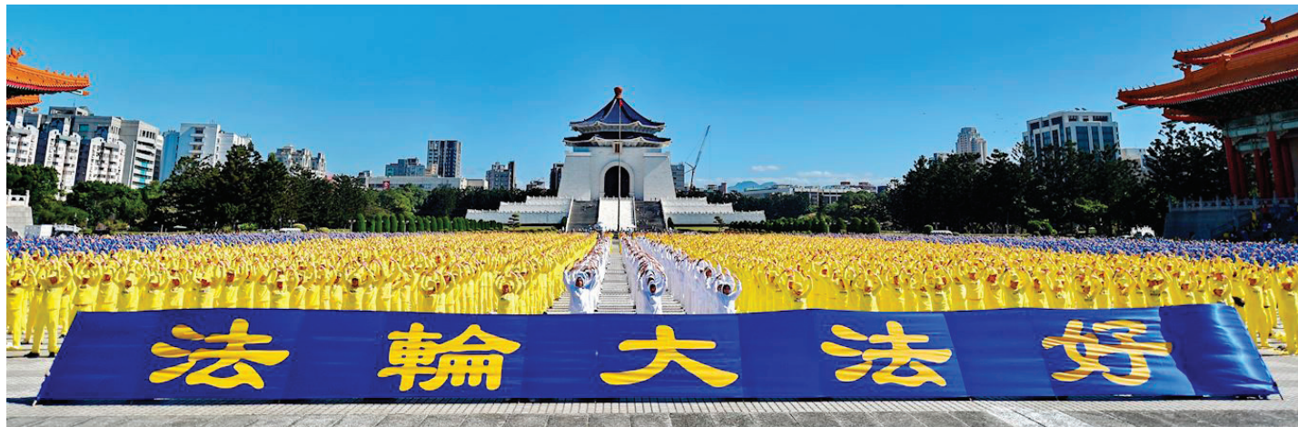
▲ 2019 年 11 月 16 日，约六千五百名法轮功学员在台湾台北自由广场集体炼功。