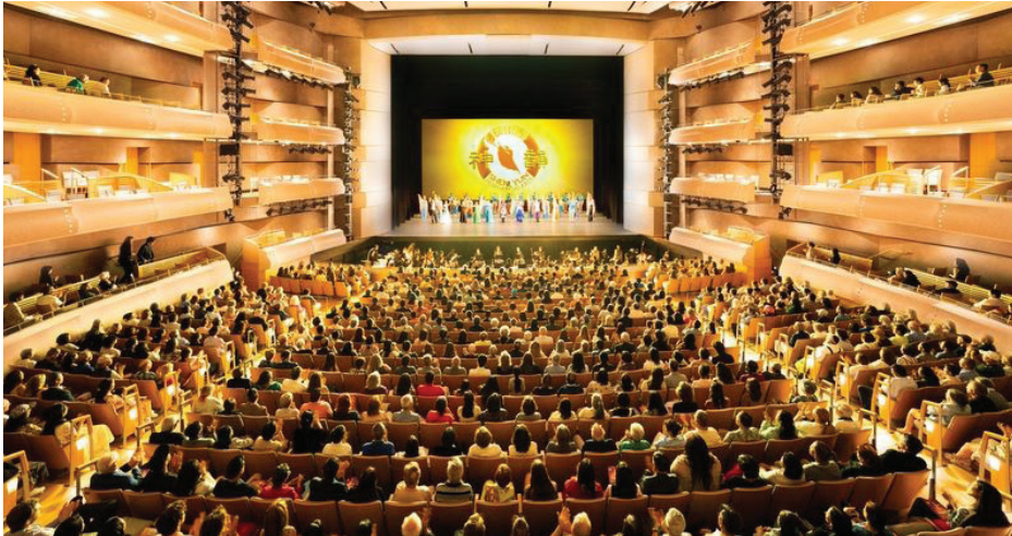
▲ 6月28日, 神韵在多伦多第五场演出圆满落幕。现场座无虚席。

【明慧网】2026年6月25日至28日, 美国神韵纽约艺术团重返多伦多, 在多伦多四季演艺中心举行了四天五场的演出。演出连场爆满, 最后一场一票难求, 剧院内座无虚席。今年三月神韵曾因中共的虚假炸弹威胁而被迫暂时取消, 此次神韵重返多伦多, 为2026年神韵全球巡回20周年演出季画上圆满句号。