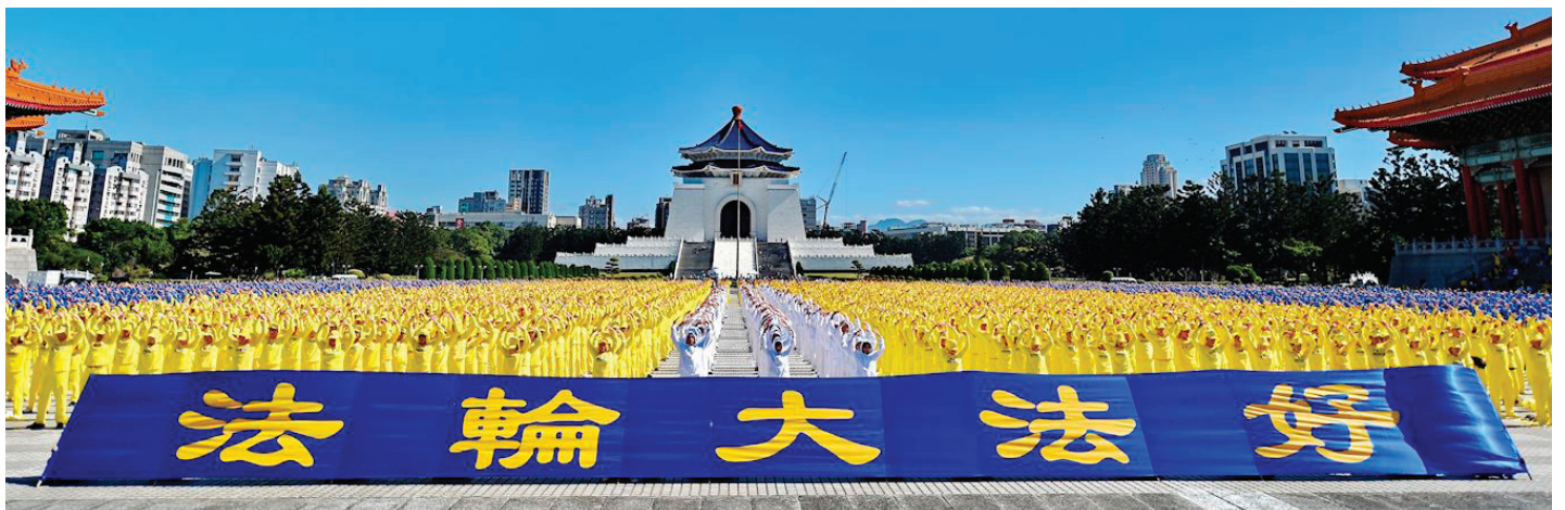
▲ 2019年11月16日，约六千五百名法轮功学员在台湾台北自由广场集体炼功。（明慧网）