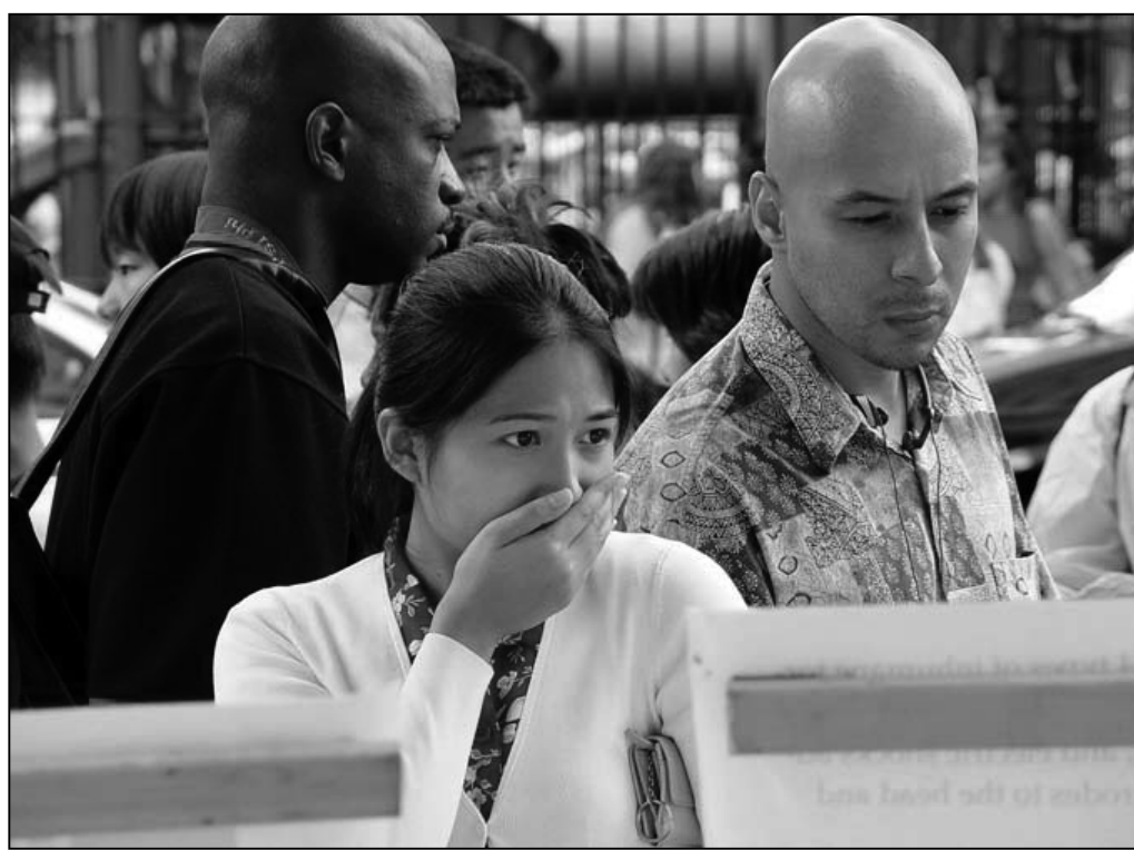
圖：觀看法輪功學員反酷刑展而被震驚的觀眾。

當神用四次瘟疫毀滅羅馬的時候，當神用烈焰熾烤罪惡之城所多瑪與蛾摩拉時，當神用滔天的洪水