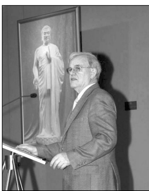
圖：薩克森聯邦州議會議長昂斯特·伊爾特根先生致開幕詞。

我們慶幸能有這樣一種自由，去遵從那些發自自己良心的決定，而不會因此而遭受迫害。為了使理想成真，我們竭其所能，進行著不懈的努力。說到本次『真善忍美展』，畫展上展出的藝術品非常清楚的表達了，天人合一、展現精神的反抗力量和匡扶正義意味著什麼，和這需要怎樣的勇氣和能量。 由於國際真善忍美展的內容涉及人間至高無上的價值，涉及人權以及對人權的捍衛，這一主題得到了薩克森州憲法最高機關——州議會的認同，薩克森州議會對畫展舉辦單位提供了大力的支持。 在這一美術作品展覽中，參觀者將通過一幅幅給人深刻印象的畫作感受到畫中人物遭受到的痛苦折磨，這一幅幅畫作記載了人權在地球的另一端是如何受輕視，甚至是被滅絕人性的踐踏。 法輪功修煉者，就像他們在遍及全球的反迫害遊行上控訴的